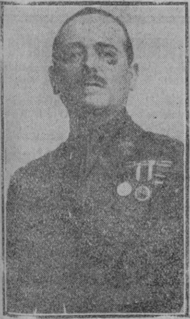
El general José Millán Astray, nombrado coronel honorario del Tercio.

Las circunstancias políticas de la época obligaron a los europeos, especialmente españoles y portugueses a procurarse nuevos caminos para llegar al Extremo Oriente, pues los Estados musulmanes establecidos en el Asia central y a lo largo del mar Rojo, habían interceptado para ellos los únicos caminos conocidos, y percibían grandes tasas por las mercan-