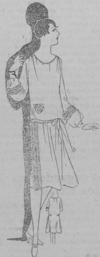
VESTIDO. —Vestido de voile blanco guarnecido de cruches plisados sobre los lados y en las mangas. Motivo bordado en colores sobre el bolsillo.