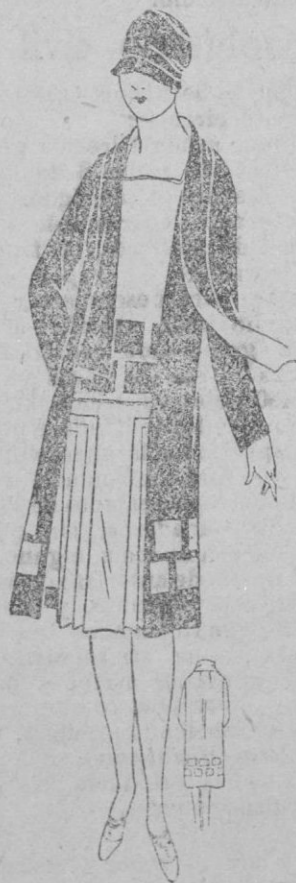
TRAJE. —Traje de crespón Bosphoro «azalé» para el vestido y negro puro para el abrigo. Trabajo de plisados en la falda y cuadros de incrustación.