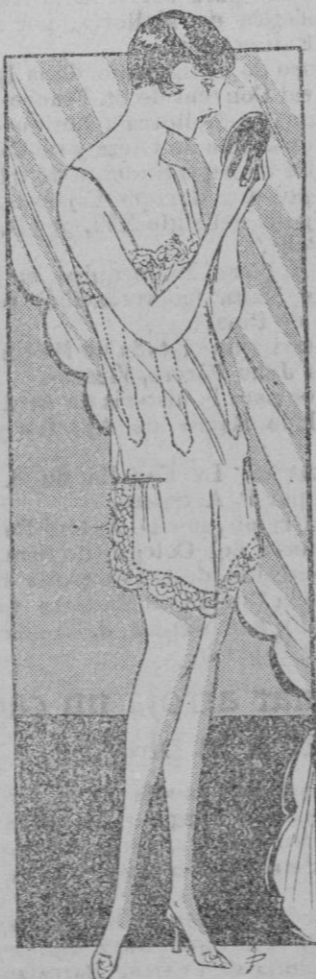
COMBINACION-PANTALON. —He aquí una combinación cubre-corsé pantalón que tiene el siguiente figurín:

De la época de la diligencia, es la afición a los baños de mar. Los usos de moda la duquesa de Borry por razones de salud; la duquesa y sus damas de honor, llevaban trajes de ba-