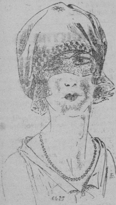
SOMBRERO. —Boina drapé de terciopelo negro guarnecido de bordados de «ganses» de plata imitando monedas.