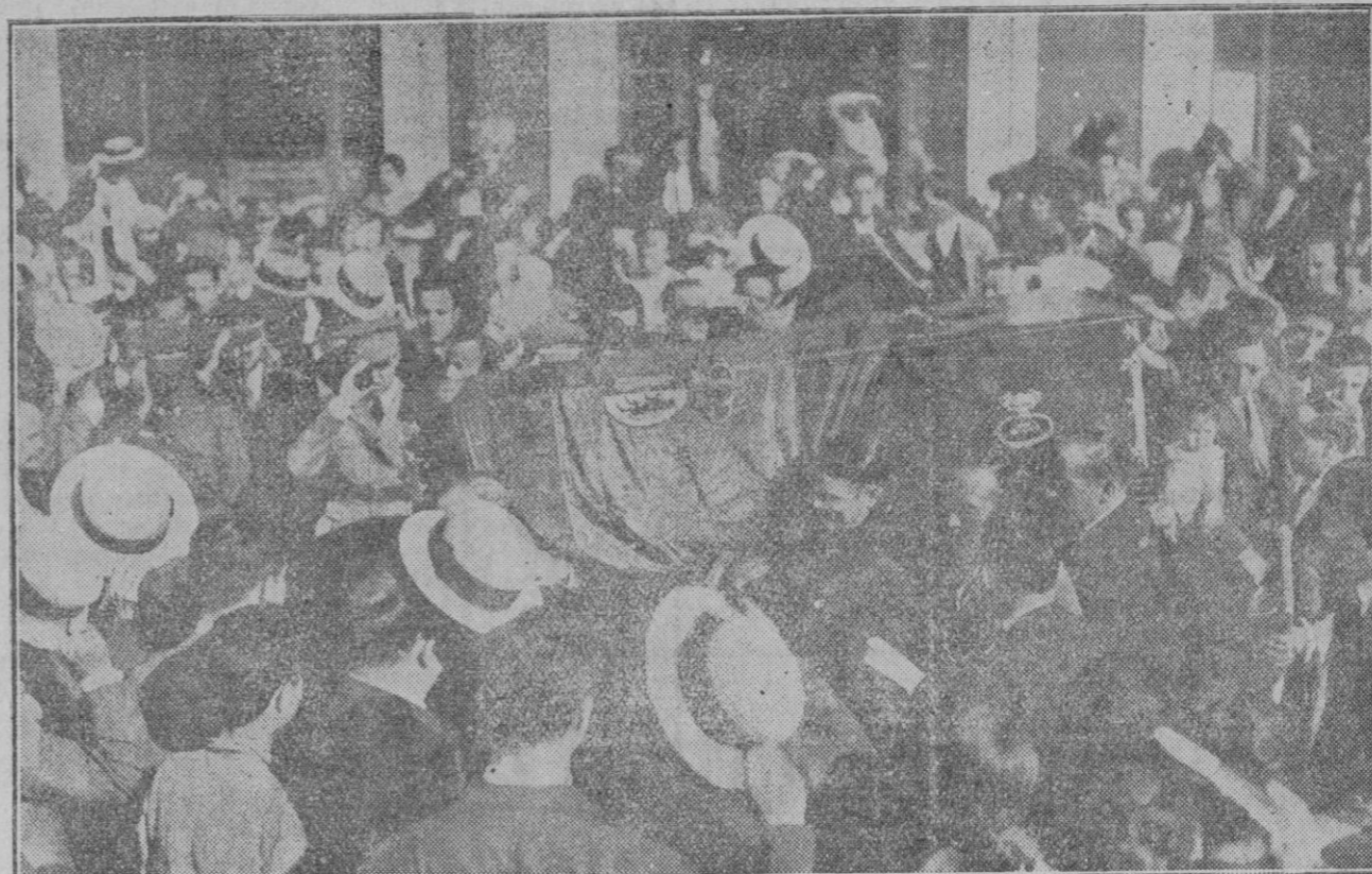
MADRID—EN LA ESTACION DEL NORTE

¿Es ésta necesaria? ¿Es, si quiera, conveniente? Creemos lealmente que no; por eso seguimos sin explicarnos que se defienda la Asamblea. Pensamos, como ABC, que de la dictadura actual hay que salir por el Parlamento, y eso es lo que en el orden de los hechos demostrará la razón de haber proclamado que el régimen presente es transitorio.»