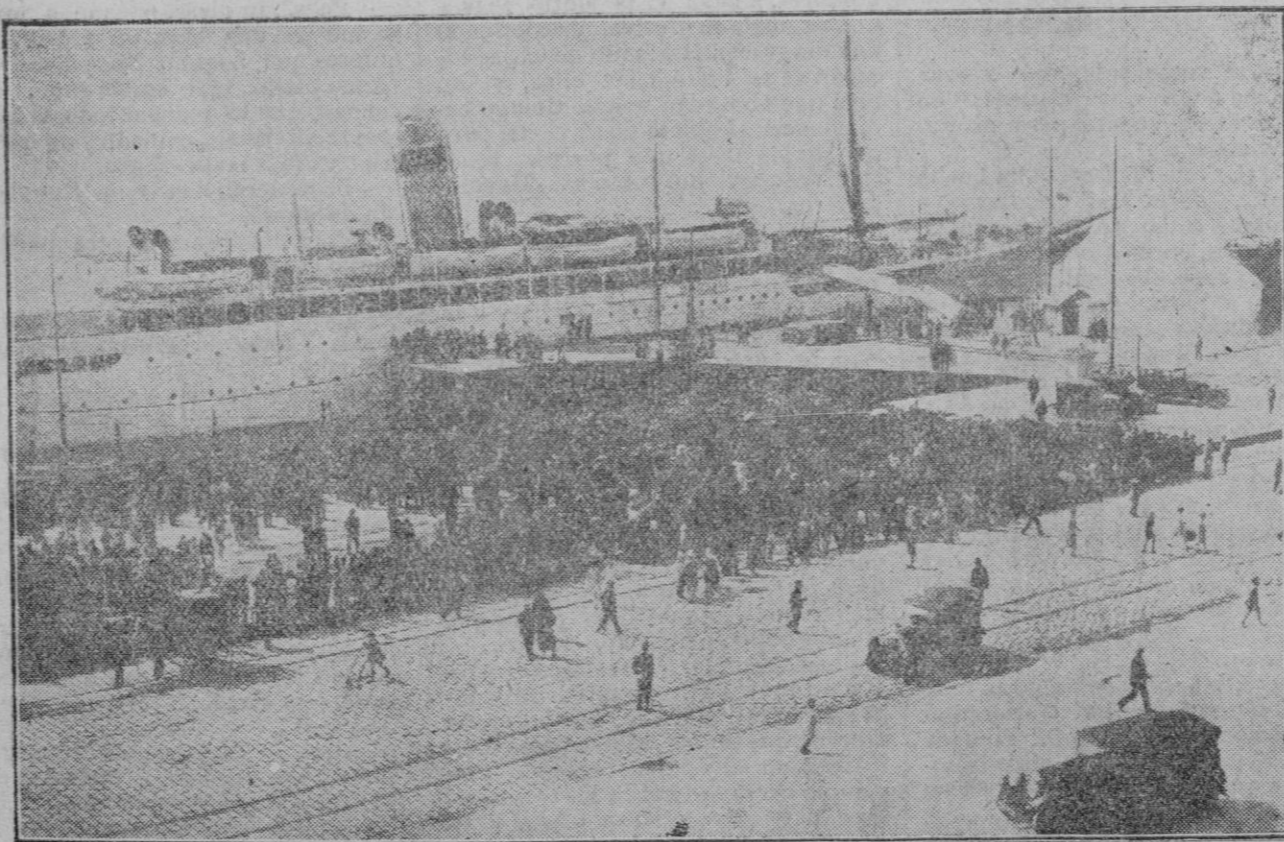
SANTANDER.—LA LLEGADA DEL MONARCA

Momento de atracar al muelle el trasatlántico en que regresó de Inglaterra S. M. el Rey.