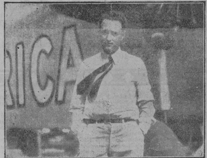
LOS GRANDES VUELOS

El aviator Richard E. Byrd con su aparato «América» con el que realizó el vuelo sin escalas Nueva York-París.