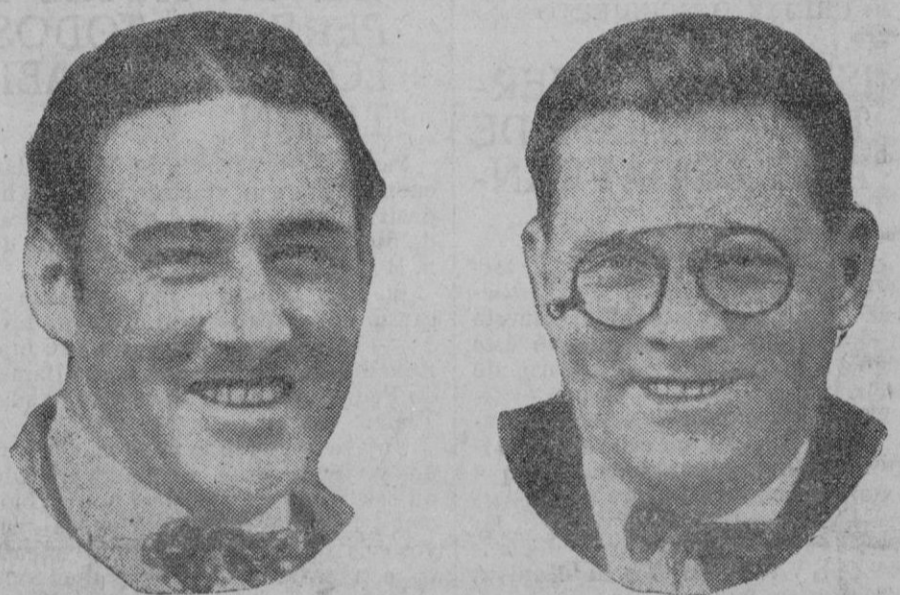
Sus dos acompañantes pilotos Bert Acosta y George Neville.

El aviator Richard E. Byrd con su aparato «América» con el que realizó el vuelo sin escalas Nueva York-París.