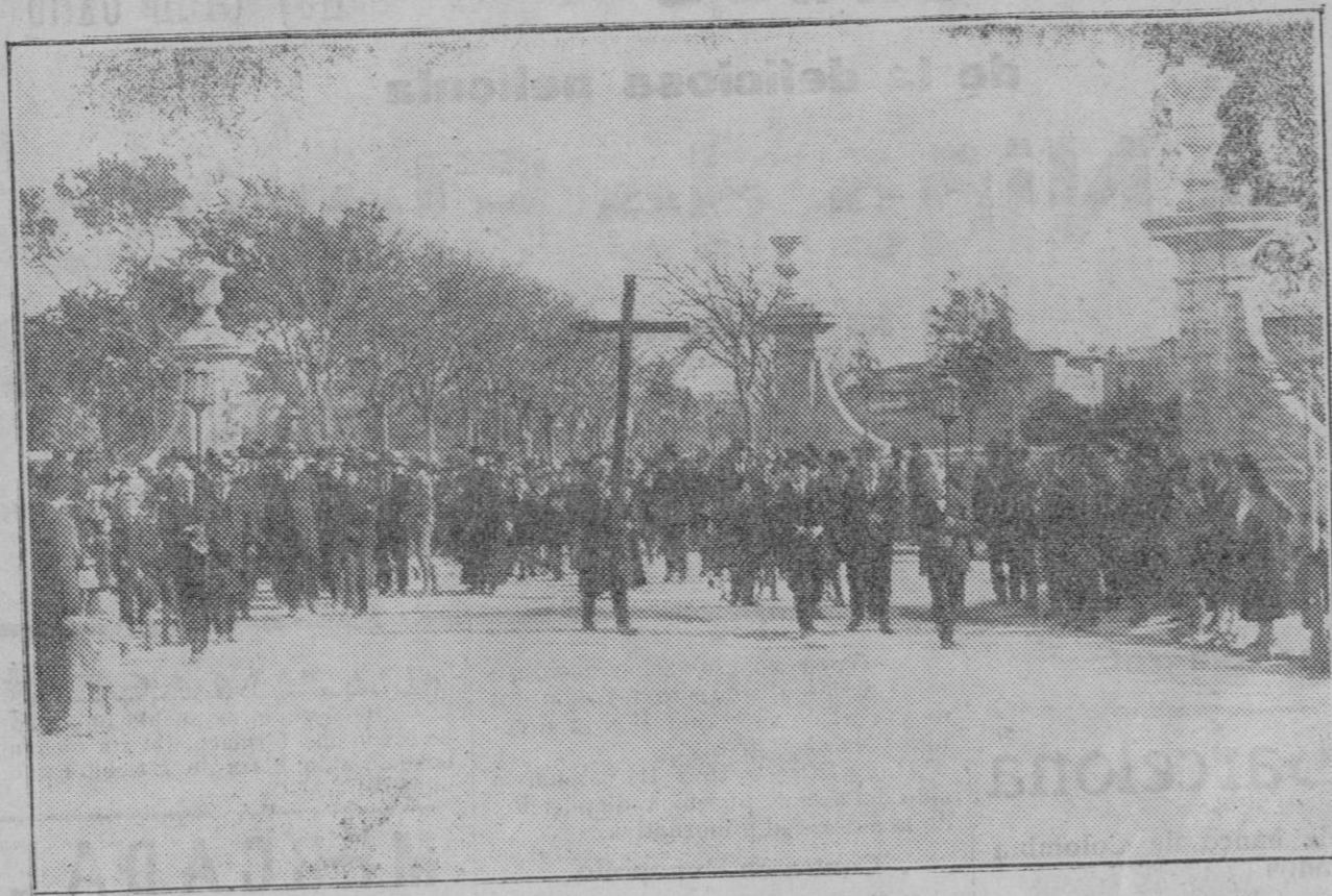
La procesión que se organizó para ir al Cementerio a dedicar un piadoso recuerdo a los que allí descansan.