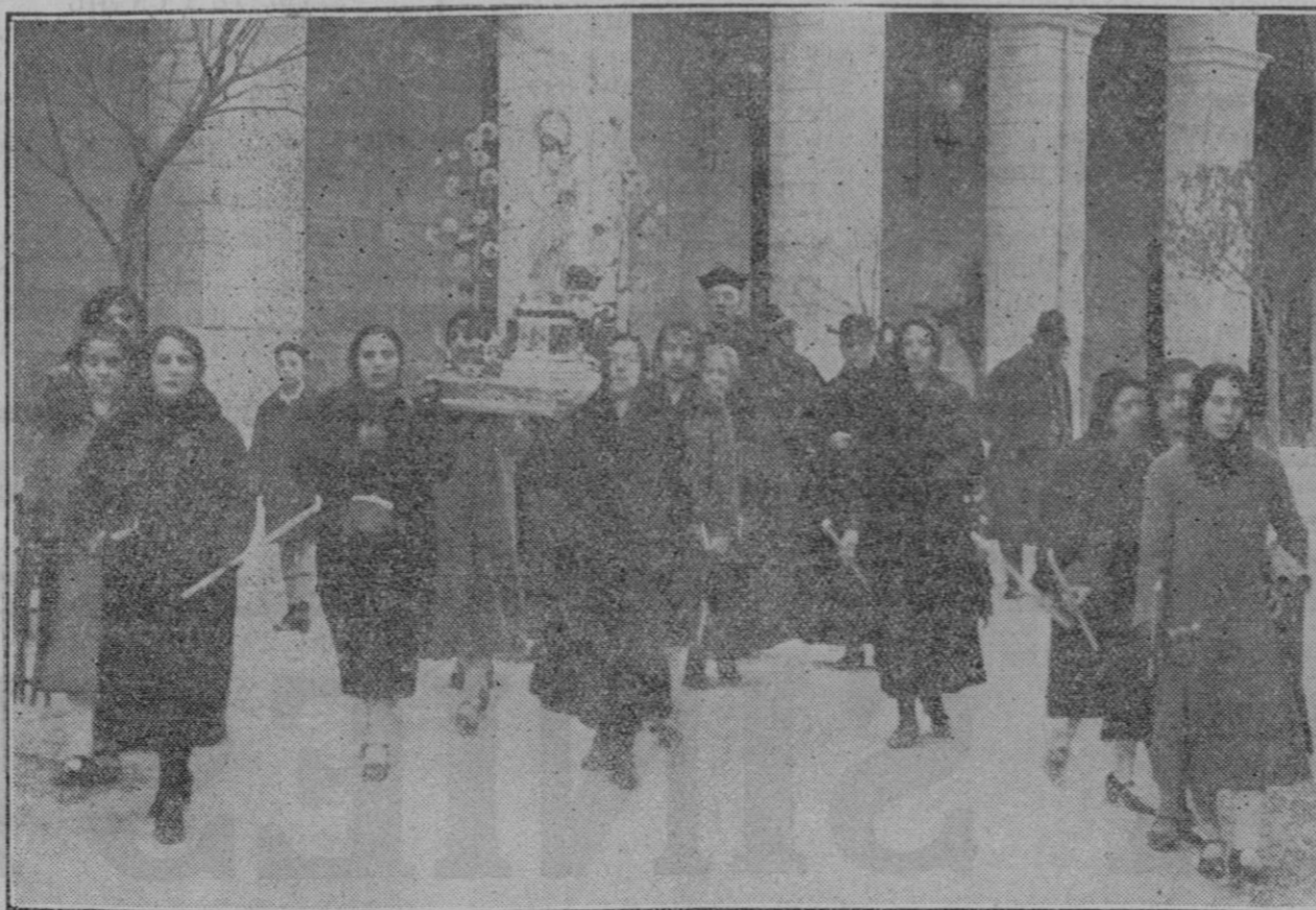
Presidencia de la procesión del Rosario de la Aurora, organizado en la S. I. Catedral. Grupo de señoritas que llevaban en andas la imagen de la Reina de los Cielos.