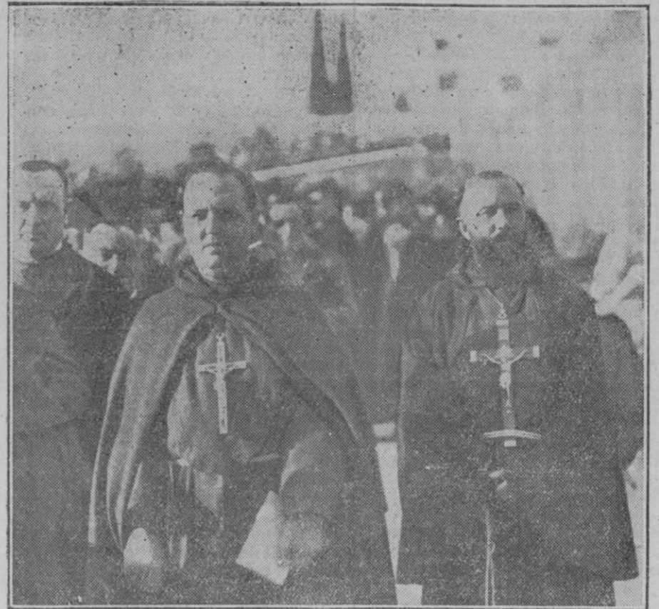
Reverendos Padres Misioneros de las Ordenes de S. Francisco y Capuchinos que se encuentran en Palma con motivo de la Santa Misión que se está celebrando.