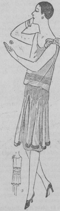
TRAJE.—Traje de crepé geo verde nilo formando túnica, orlada con piel. Es ajustado al talle por dos pliegues de nerviosidades.