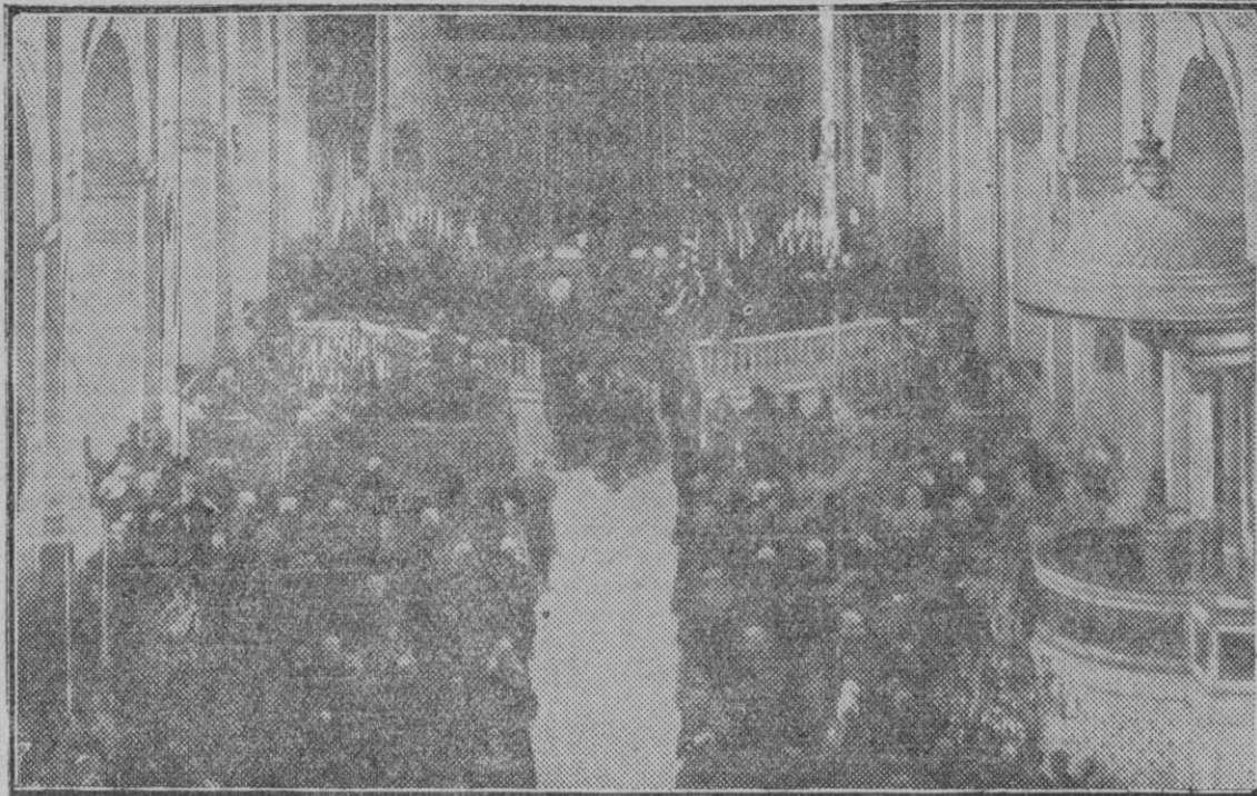
PARIS.—EN LA IGLESIA DE LOS INVALIDOS Interior del templo durante la misa celebrada en sufragio de los muertos en la guerra europea.

El profesor Stuart se expresa en estos términos: «Sensibilidad, obligación, emulación, valor, dignidad, altruismo».