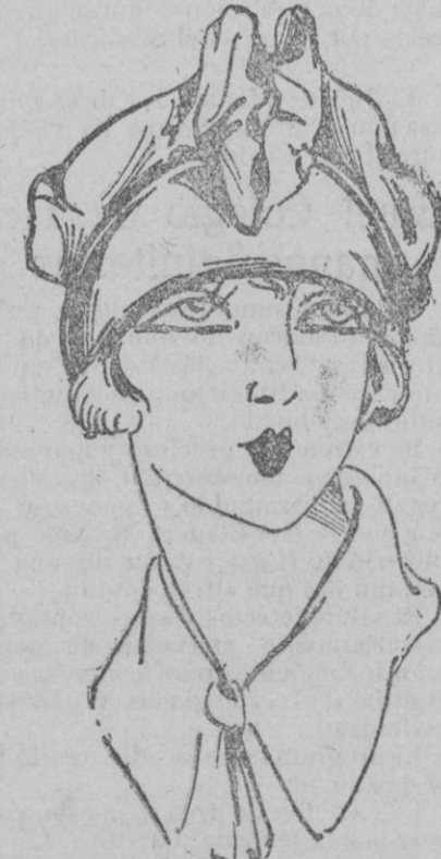
SOMBRERO.—Mas tafetan para los primeros días bellos. Este fresco modelo de tafetan y grano grueso maderera de rosa.

En cuanto al verdadero peinado masculino—al uso de las damas—