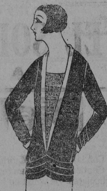
CASACA.—Casaca de crepé satón verde ciprés, reversos de satón blanco y encaje ocreado.