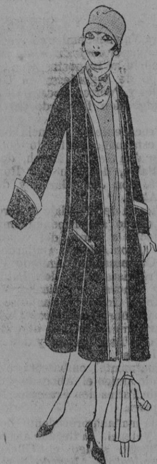
ABRIGO.— Abrigo de viaje de duvetine oxidada forrado con duvetina beige, que forma al mismo tiempo los adornos y los reversos.