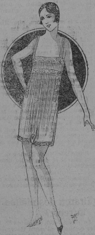
CAMISA-PANTALON.— Presentamos en esta figura 5.663 amplia materia para renovar los vestidos interiores. Es una exquisita combinación-pantalón, muy elegante. Este modelo de pliegues muy finos continúa hasta abajo es de limón de hilo blanco, adornado con un anillo entredós de Valenciennes, colocado alrededor y sobre el delantero para juntar los pliegues.

Se ha reprochado a los modistos de nota que trabajan para agradar a las extranjeras y que han perdido el gusto delicado que era exclusivo de París. Este reprocho es exagerado. No cabe duda de que hace unos años la elegancia era más discreta; pero los propios artistas decoradores son los que nos han iniciado en las alianzas audaces de colores. (Acaso constituye un error reanimar la elegancia que se había democratizado demasiado de algún tiempo a esta parte. No podríamos responder seguidamente. El vestido de buen corte, pero de tonalidad oscura es de un efecto un poco triste con la luz artificial en tanto que los fourreaux de lamé de oro y de crepón perlado tienen una digna prestancia y vienen a crear un estilo nuevo. Resulta difícil deducir de la moda actual una idea de conjunto. Cada casa cultiva un género diferente, se ven vestidos que evocan los modelos de 1890 y otros drapés que ajustan perfectamente a la forma del cuerpo. Análogo diversidad se advierte en las telas. Esta temporada las mujeres elegantes muestran gran