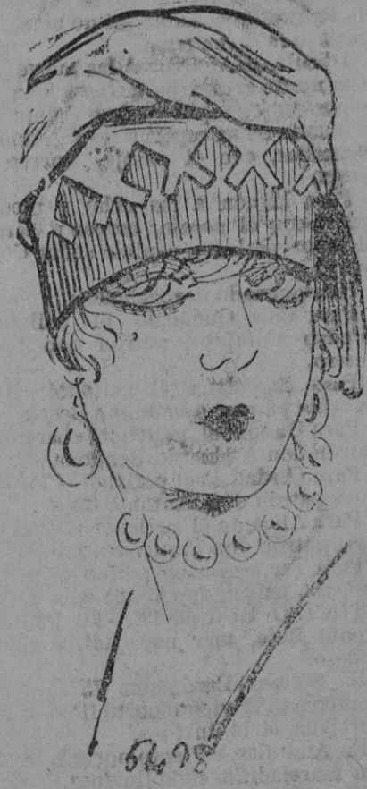
SOMBNERO.— Sobre el borde de grueso grano, la calota flexible de fieltro se aplica recortándose lo que desea cualquier otro adorno. En el modelo, una bellota colocada con gracia da tono a este tocado.