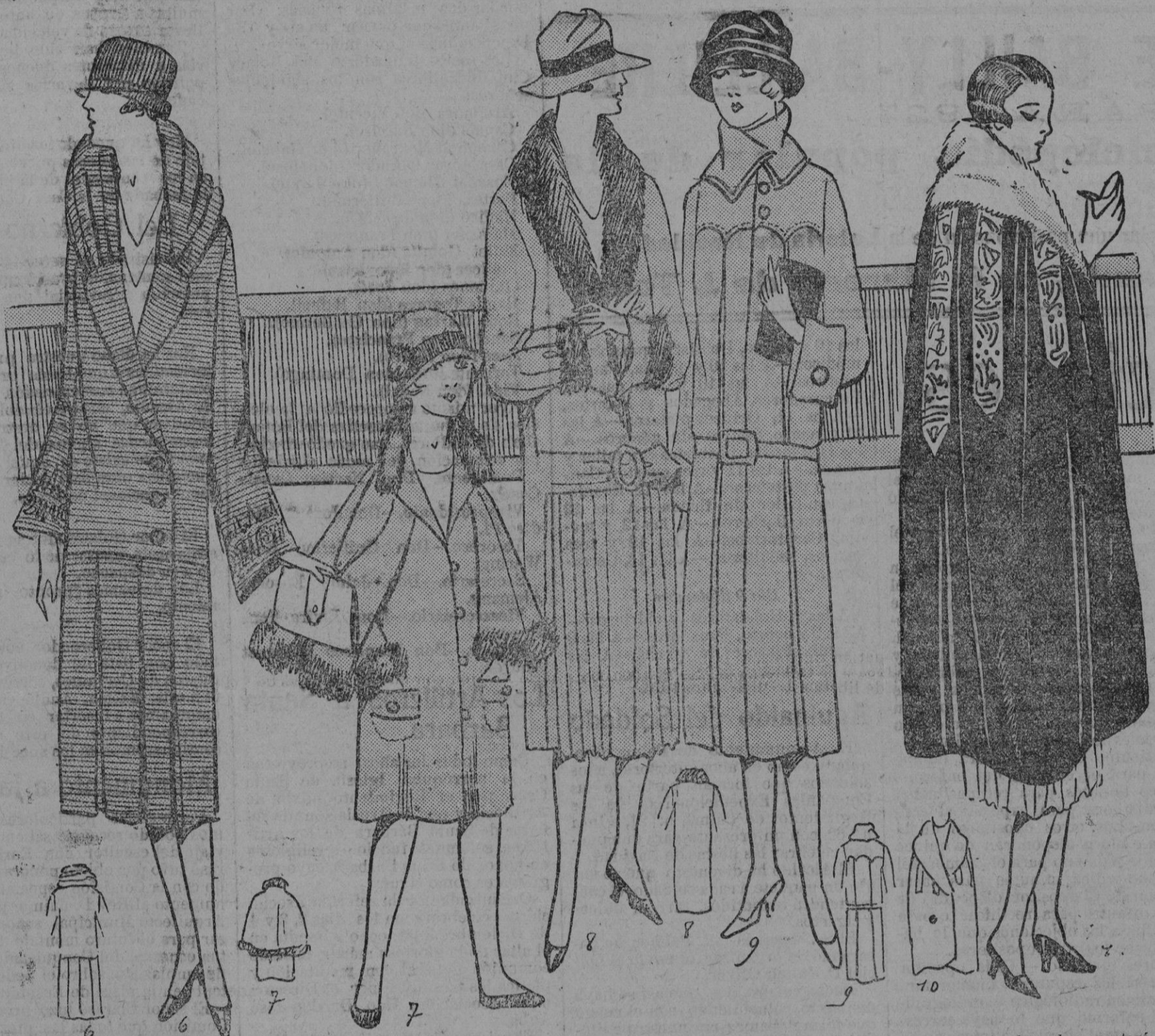
PANORAMA ABRIGOS.—1 Abrigo de «coto» de caballo color habana; será cortado en dos partes, cuerpo bastante largo bajo el cual se montará falda ya plisada. Las bocas-mangas están bordadas con sutacha.—2 Para la niña, he aquí un elegante abrigo de paño encarnado, cuya pelarina y el cuello serán adornados con una piel oscura. Metraje 2 m. 35 de 130.—3 Abrigo de terciopelo de lana gris, la espalda cortada en una sola pieza que se continúa sobre el delantero formando cintura. El delantero de la falda será enteramente plisado y montado al cuerpo. El cuello y las mangas serán adornados con piel. Metraje, 4 m. 50 de 130.—4 Pensemos en los días de lluvia y confeccionemos este hermoso abrigo covercoat impermeable. El cuerpo de gruesos pliegues es montado. Metraje, 5 m. de 120.—5 En fin para recubrir los trajes ligeros, he aquí una elegante capa de terciopelo castaño, adornado con bandas de cinta oro, y con un cuello de renard azul. Metraje, 3 m. de 1 m.

El procedimiento es agradable no dando lugar a molestia alguna.