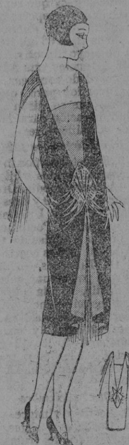
TRAJE.— Traje para noche de terciopelo encarnado viejo, sobre fondo plata. Hermoso bordado plata y strass. Franjas de plata.