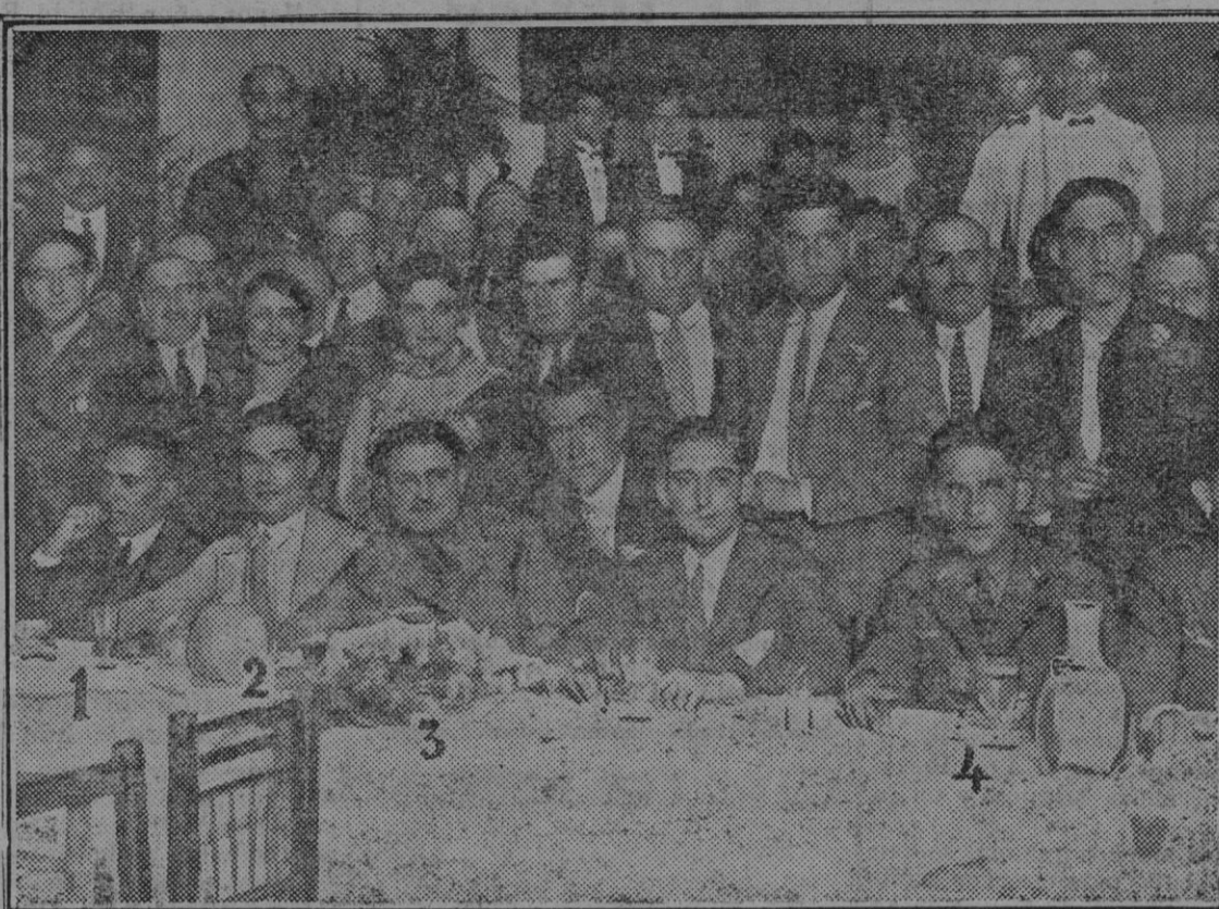
MADRID.—EV CASA DE JUAN.—Bataqueo popular organizado por el Comité hispano-filipino en honor de los héroes aviadores Lórgica (1), Gallarza (2) y Estevez (3) y su mecánico.

Mallorca no podía dejar de hacer lo propio. El acuerdo tomado ayer por el Ayuntamiento hace efectivo este deber, y de ello nos hemos de congratular todos con complida y sincera alegría.