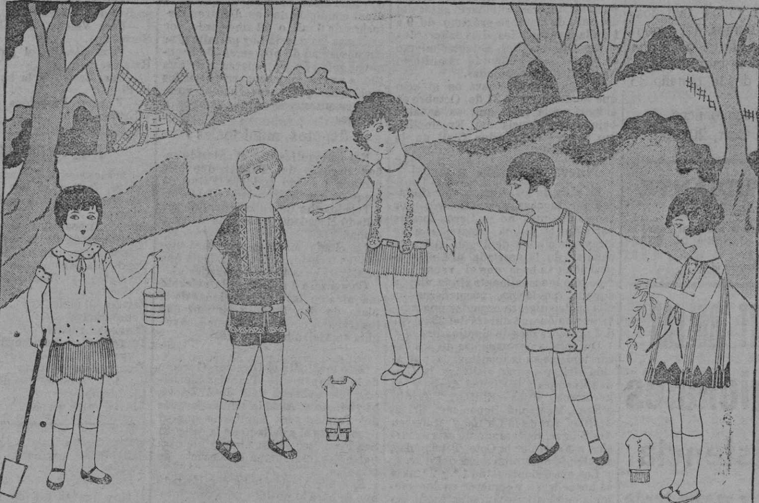
PANORAMA.—NIÑOS.— 1 Pequeño traje de crepé de china rebordado azul pastel. 2 Traje para niño, de terciopelo negro, encarnado y oro. Pequeño chaleco de adamsaco blanco. 3 Sweater de tela de seda cereza rebordado del mismo tono; pequeña falda de tela de seda blanca plisada. 4 Traje de niño en tela de seda amarilla bordada tango. 5 Traje para niña, en ve o salmon; incrustaciones del mismo tono, de crepé de china. Pequeño chaleco de encaje.