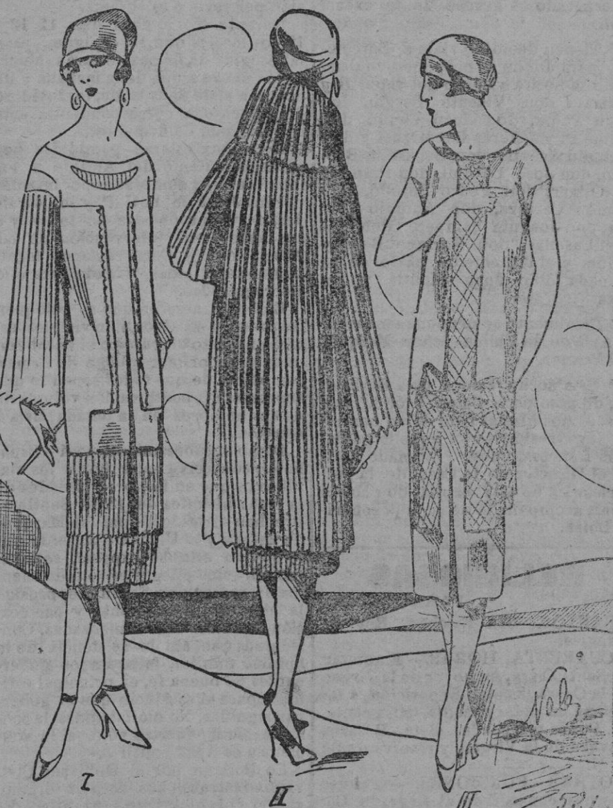
PANORAMA.—TRAJES.—El empleo de los plisados es infinito, este mismo traje de crepé interpreta graciosamente esta fantasía y la túnica recta se abre ligeramente sobre el fondo enteramente plisado: Un abrigo recto, plisado, pantalón, es fácil de llevar, al mismo tiempo que muy elegante. De tafetán unido y esocós compone éste sencilló y encantador traje abierto sobre un chaleco plano terminado con un grueso lazo.

A pesar de las innovaciones que acabamos de consignar, la evolución del corte es muy lenta. La verdadera originalidad hay que buscarla en las telas y en los detalles. De entre los numerosos detalles que realizan las creaciones uno de los más encan-