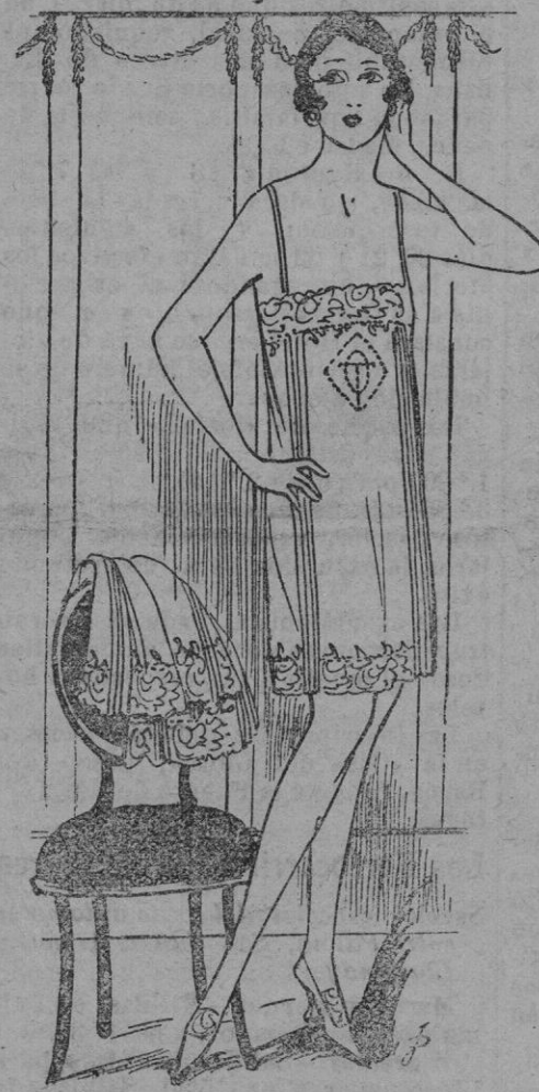
ADORNOS.—Adorno de camisa y pantalón surtidos en lino incrustado de encaje fino de Malines. Grupos de pliegues son colocados por cada lado. El monograma bastante grande está hecho con deshilachado.