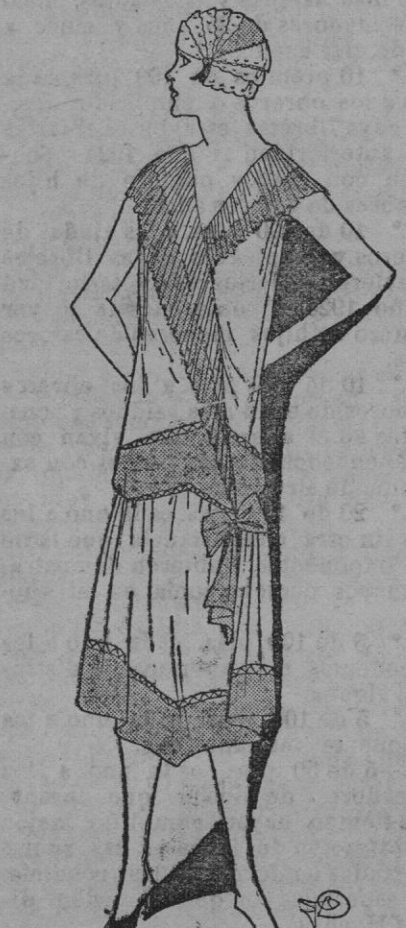
CAMISA DE NOCHE.—Es muy bonita la que presentamos, de crepé de china azul lino y rosa Bengala. Su doble plisado del bonete de tul bis y crepé de china azul lino.