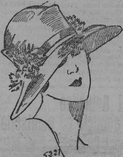
SOMBRERO.— Sombrero de paja manila blanca, cinturado con cinta de terciopelo azululado con una simetría buscada de escarapelas de azulado y botones rosas.