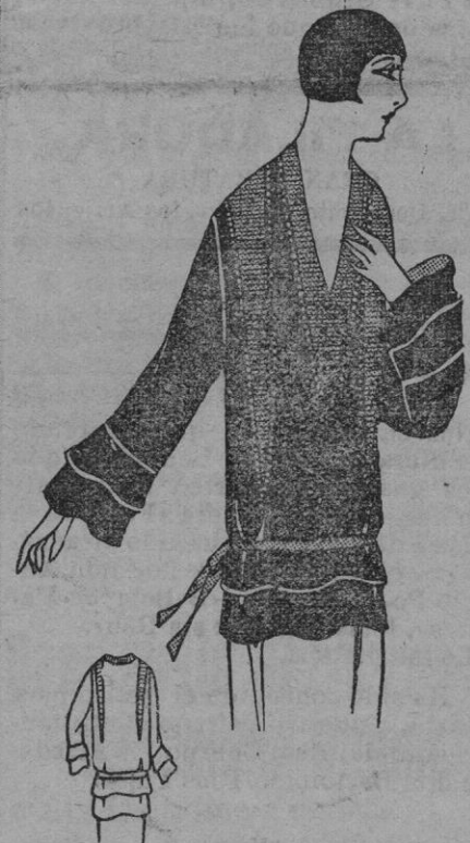
CASACA.—Casaca de reps de seda azul rey y gao, pequeños pliegues cogidos del mismo tono, pequeños perlas de acero.

Y así, no obstante las tentativas realizadas para lograr que la mujer cobre afinidad a una línea más lógica y armónica que síde el talle en el lugar en que la naturaleza le señaló,