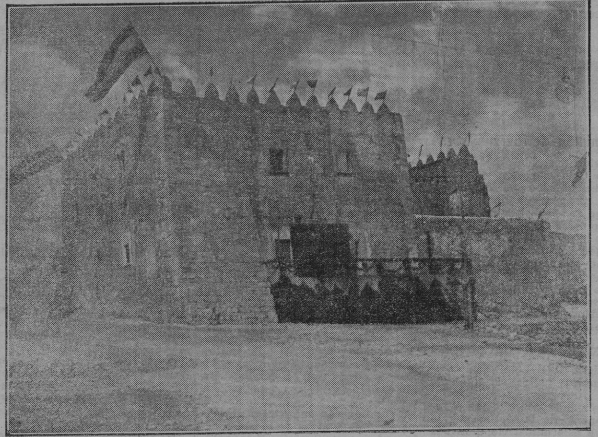
La famosa «Torre de ses Puntet» (Mansor), declarada Monumento Arquitectónico Artístico, donde ha sido instalado el Museo Arqueológico Municipal, inaugurado con gran solemnidad el domingo 6 del corriente.

—No puedo devolverte nada. La verdad es ésta. Ya puedes figurarte que si yo hubiese heredado no estaría