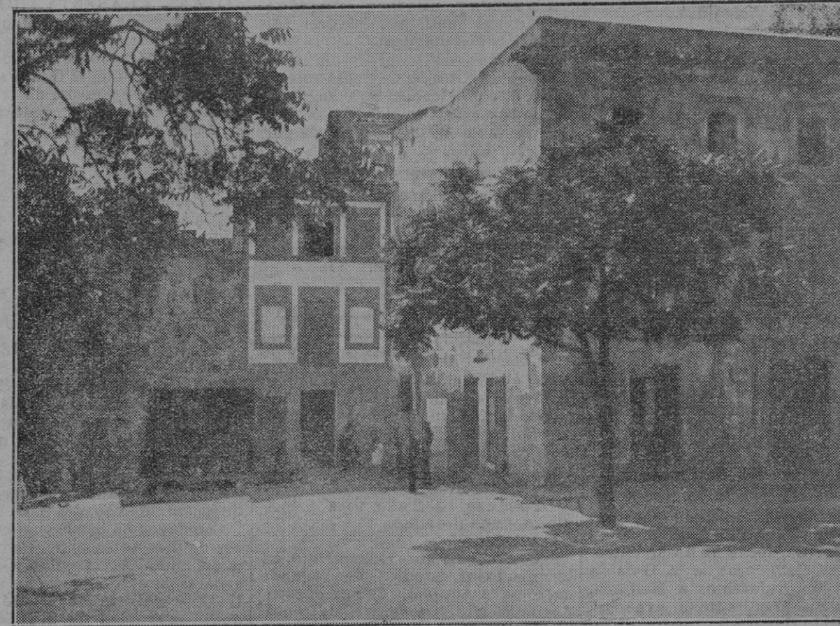
Mansor.—Grupo de casas que ha de ser derribado con motivo de la construcción del nuevo Mercado y cuya primera piedra fué derribada por el señor Gobernador Civil. El acto fué revestido de gran solemnidad. (Foto Moyá).