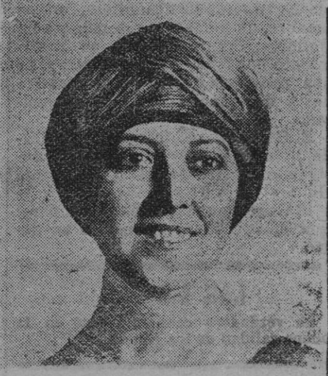
París.—Mlle. Musidora, la popular artista francesa, que ha sido proclamada reina del cinematógrafo.

Si algún ejemplar cae en manos del lector, por lo examinado puede juzgar el resto de esa verdad, de la que no queremos, en el presente caso, decir que tiene nombre de mujer, porque las mujeres, a pesar de su fama, no... fantasean tanto.