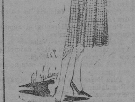
Vestido en popelina marino y popinette a cuadros marinos, sobre un fondo gris.

El hombre es la más elevada de las criaturas. La mujer, el más su blime de los ideales.