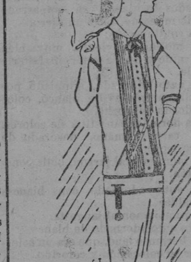
Blusa en toile de seda ivoire, adornada con alforitas y galón azul marino.

A los colores cálidos como el violeta ópera y rojo que estuvieron de