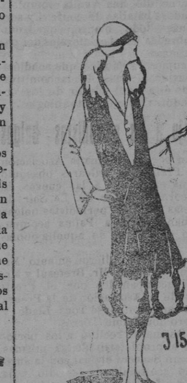
Elegante vestido de Kasha blanca y azul-roy, adornado con piel blanca.

Los grandes modistos no se olvidan de las niñas. Para ellas crean modelos exquisitos inspirados en la