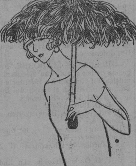
Sombrillas en plumas de avestruz, color naranja y negro.

Se prevee algún cambio profundo e imprevisto, capaz de cambiar nuestra manera de ver y comprender la silueta femenina? Cambió que hiciera marcar época el estilo de ayer?