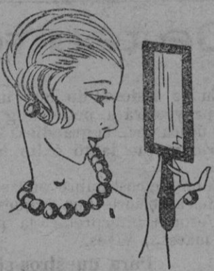
Collar, pendientes y sortijas, en grandes perlas de plata.

Las tendencias de la Moda para el otoño o el invierno, ya han sido reveladas en París, pero pocos cambios tenemos que adoptar sobre la ropa interior.