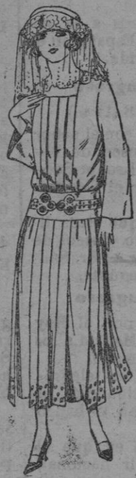
Vestidos de popelino, sarga, etc., en negro, azul o color, adornos bordados. de ptas. 95 a 110.