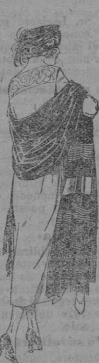
Charpas de seda, diferentes dibujos y calidades. de ptas. 20 a 200.