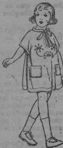
Delantales de voile, colores moda, adornos bordados, para niñas de 3 a 6 años. de ptas. 12 a 18.

Ropas confeccionadas para Caballero, Señora, Niño y Niña