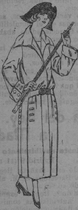
Abrigos de gabardina inglesa, impermeabilizada en negro, azul y color. de ptas. 85 a 200.