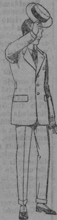
Trajes modelo Sport de lanilla melton etc. de ptas. 52 a 125.