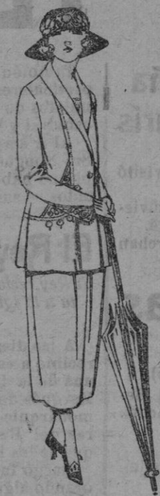
Trajes sastré, de sarga inglesa, popelino, etc., adornos bordados, chaqueta forrada de seda, en marino, negro y colores moda de ptas. 125 a 160.