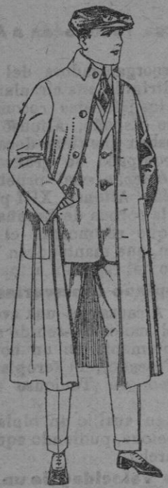
Guardapolvos de dril, igual al modelo. de ptas. 10 a 20.

SUCURSALES: MADRID, BARCELONA, ALICANTE, ALMERIA, BILBAO, CADIZ, CARTAGENA, GIJON, GRANADA, MALAGA, SANTANDER, SEVILLA, VALENCIA, VALLADOLID Y ZARAGOZA