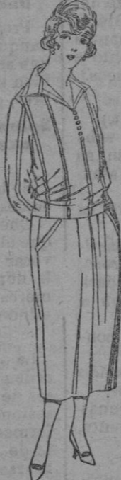
Blusas de voile de seda listada, colores moda, de ptas. 23 a 27.