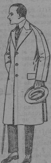
Gabanes de melton, gabardina, etc. de ptas. 60 a 180.