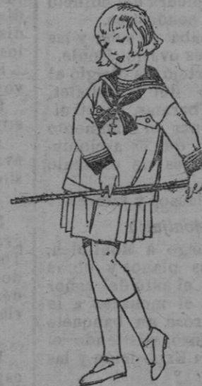
Trajes modelo, «Marinera inglesa» de dril, otomán o satén blanco, para niñas de 4 a 9 años. de ptas. 20 a 35.

Gorras, Sombreros, Cinturones, Calcetines, Corbatas, Pañuelos, Fajas, Ligas, Tirantes, etc.