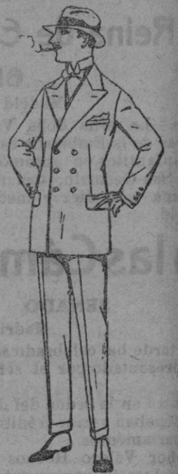
Trajes de lanilla, melton, estambre, vicuña, jerga, etc. de ptas. 40 a 150.