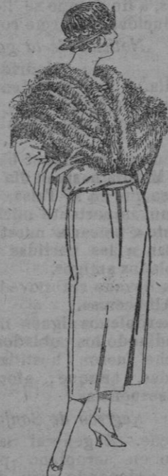
Capellinas de marabú, diferentes modelos en negro, blanco y marrón. de ptas. 30 a 75.