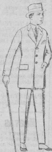
Trajes de patén, vicuña o jerga, para niños de 10 a 12 años, de ptas. 37 a 83. Los mismos, para jóvenes de 13 a 16 años, de ptas. 40 a 85.