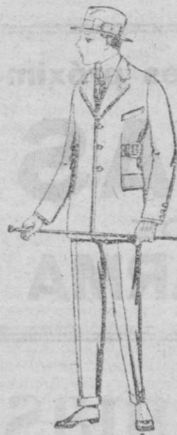
Trajes de patén, vicuña o jerga etc., forma Sport para niños de 10 a 12 años, de ptas. 45 a 83. Los mismos, para jóvenes de 13 a 16 años, de ptas. 48 a 85.