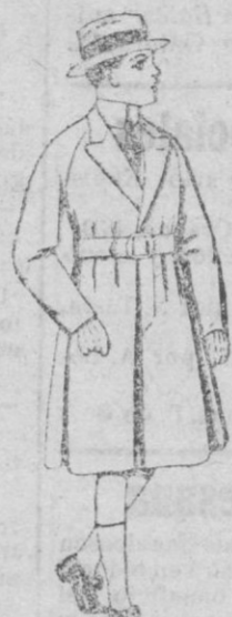
Gabanes de patén, para niños de 4 a 9 años, de ptas. 30 a 58