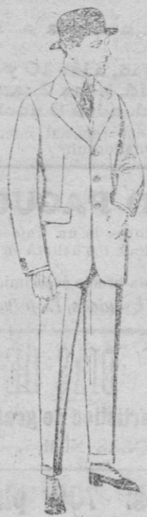
Trajes de cheviot, mel-ton, vicuña o jerga, de ptas. 47 a 190