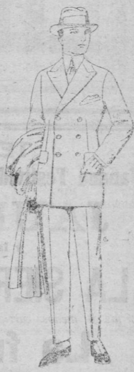
Trajes de cheviot, mel-ton, vicuña o jerga, de ptas. 55 a 190