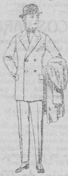
Trajes de patén, vicuña o jerga etc., forma Sport para niños de 10 a 12 años, de ptas. 59 a 85. Los mismos, para jóvenes de 13 a 16 años, de ptas. 42 a 87.