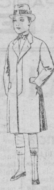
Gabanes de patén, para niños de 10 a 12 años, de ptas. 35 a 62.