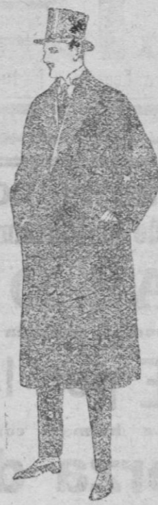
Gabanes de gamuza o vigonia, con vistas de seda, de ptas. 175 a 220

MADRID, BARCELONA, ALICANTE, ALMERIA, BILBAO, CADIZ, CARTAGENA, GIJON, GRANADA, MALAGA, SANTANDER, SEVILLA, VALENCIA, VALLADOLID Y ZARAGOZA