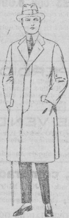
Gabanes de cheviot gamuza, patén, etc. de ptas. 55 a 70.