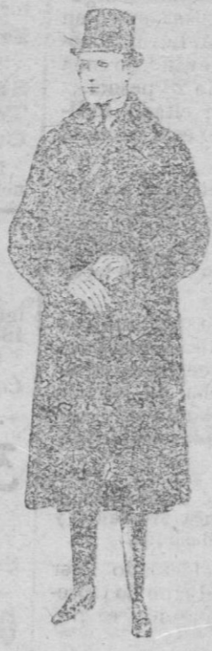
Gabanes de edredón negro, con cuello y vistas de piel, de ptas. 220 a 450.