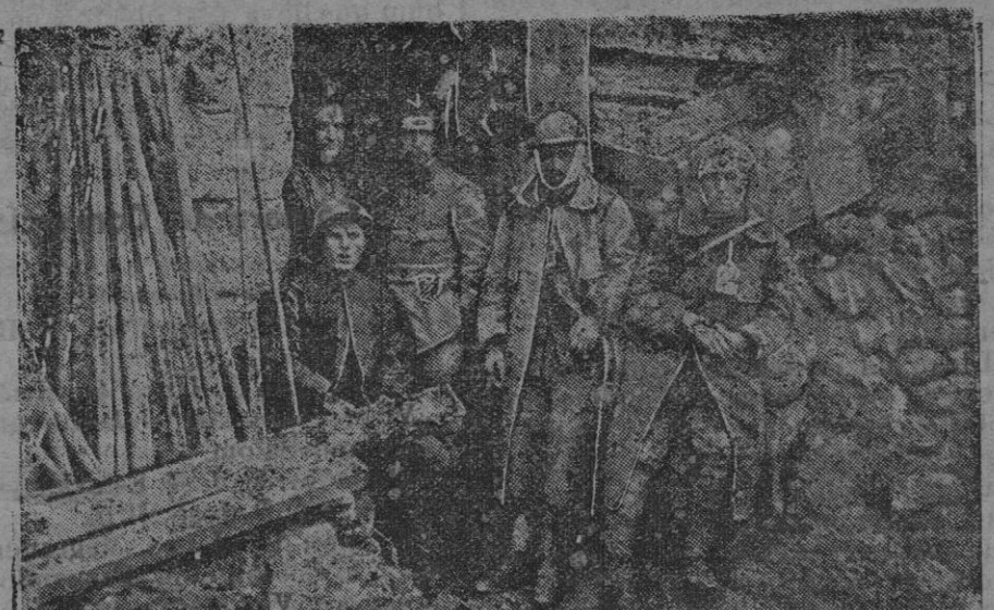
Esperando la hora de ataque en el Moza