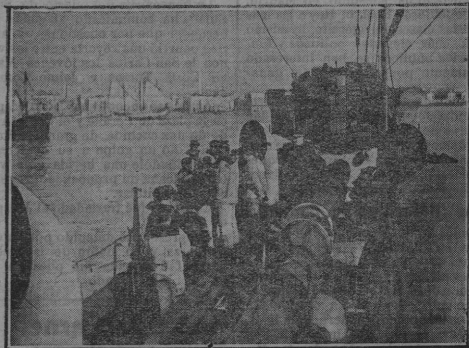
SUBICATO, VISTA DESDE UN TORPEDERO FRANCÉS.