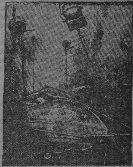
Un submarino para destruir minas.

El día ha sido satisfactorio. Los alemanes no han conseguido hacer ningún avance delante de Verdun y esperamos con confianza que una vez establecido el equilibrio de las fuerzas serán destruidos con ventaja para nosotros y derribo para el enemigo que se está agotando sin conseguir ningún éxito.