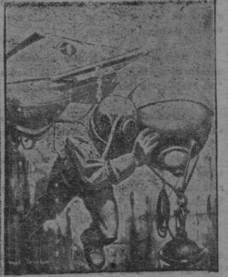
Un buzo colocando minas

La acción continúa y los alemanes habrán sido desalojados probablemente de sus posiciones, en el contraataque dirigido contra todo el frente enemigo. Al este del Mosa y en el Woevre ha habido activas acciones de artillería con el único objeto de entretenernos y no dejarnos movilizar nuestras tropas.