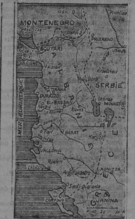
Mapa de Albania

Por motivos semejantes podrían explicarse en algunos no pocos incendios misteriosos.