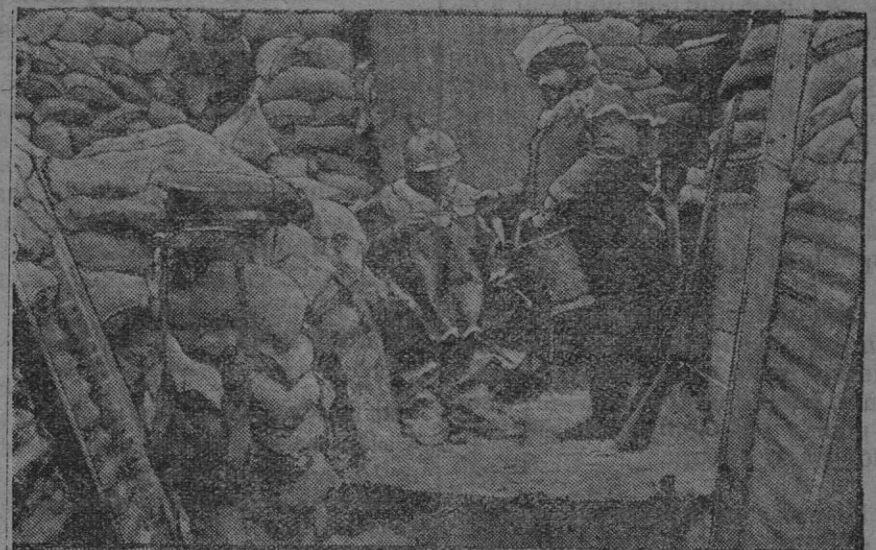
La vida de los soldados franceses en el frente.