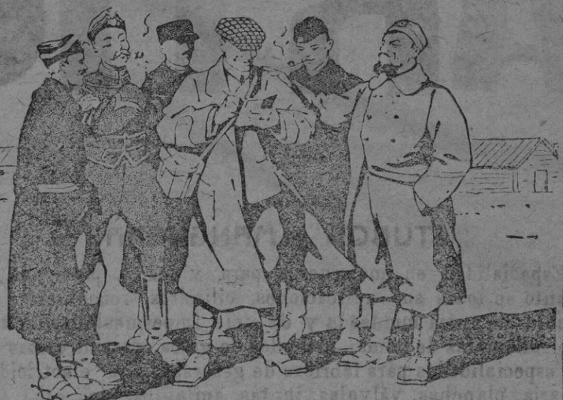
M. W*** reporter holandés interrogando a los prisioneros del campamento de Harderwyk.

Sabido es que después de luchar heroicamente contra el invasor, sumiéndose bajo el número después de luchar uno contra veinte, algunas tropas belgas evitaron el caer prisioneras pasando la frontera y refugiándose en Holanda. Conforme a las leyes internacionales estas tropas fueron internadas en campamentos, particularmente en el de Harderwyk. Entre estos soldados había muchos que si bien no estaban heridos se encontraban muy debilitados de salud, a consecuencia de las fatigas de la campaña y también como resultado del choque moral sufrido. Han sido atendidos con esmero y se han restablecido por completo. Hemos tenido una gran satisfacción al saber que muchos se han curado merced al tratamiento por las Píldoras Pink, que en Holanda disfrutan de tanto favor como en España.