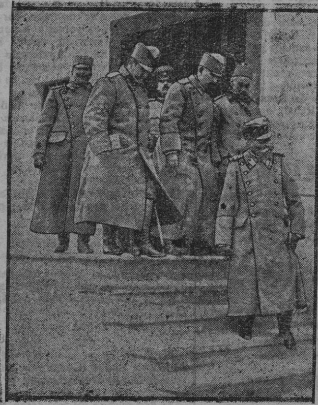
El Rey D. Pedro de Serbia y su Estado Mayor