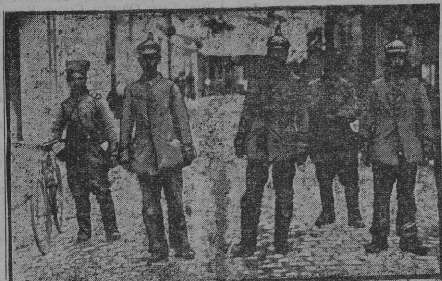
Tres soldados alemanes hechos prisioneros por los franceses