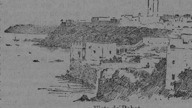
Vista de Rabat

Las más ricas kábilas de Marruecos lindan con Rabat, pero si aquellas son las más poderosas en recursos materiales, también son las más inquietas y rebeldes, tanto que las mismas autori-