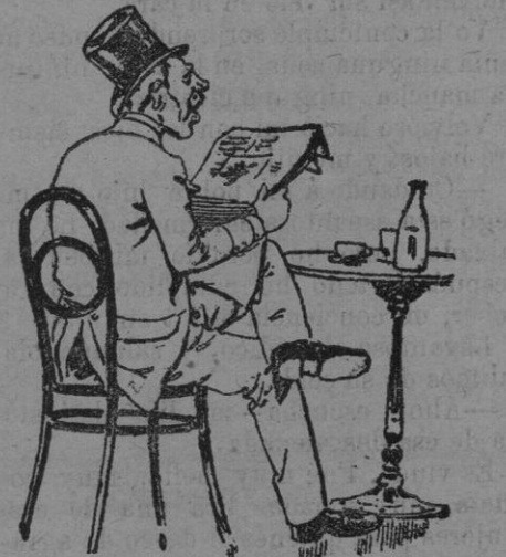
La próxima merienda

Españoles y Franceses mandan tropas á Marruecos, y puede que Casa Blanca sea merienda de negros. ¡Menos mal, si en la merienda nos reservan un cubierto!