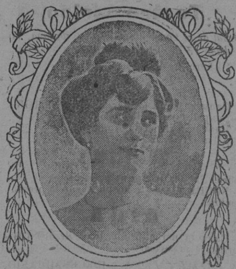
Lavándose con Jabón Gorgot

Máquinas para toda industria en que se emplea la costura.