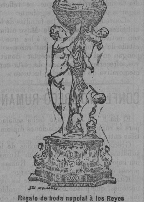
Regalo de boda nupcial á los Reyes

La República peruana ha hecho á Sus Majestades los Reyes de España un espléndido regalo.