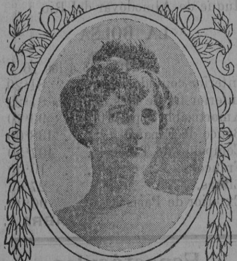
Levándose con Jabón Gergot

Se ruega al público visite nuestras sucursales para examinar los bordados de todos estilos, encajes, reales, maticos, pun to vainica, etc., ejecutados con la máquina Doméstica bobina central la misma que se emplea universalmente para las familias, en las labores de ropa blanca, prendas de vestir y otras similares. Máquinas para toda industria en que se emplea la costura.