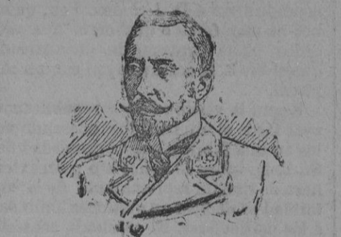
Mr. Gerlache, comandante de la expedición