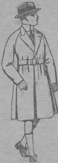
Gabanes de patén para niños de 4 á 9 años. De ptas. 22 á 50