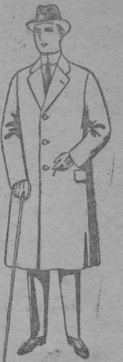
Gabanes de cheviot, gamuza patén, etc., De ptas. 48 á 150 Los mismos á medida. De ptas. 80 á 230

Ropas confeccionadas para Caballero, Señora, Niño y Niña