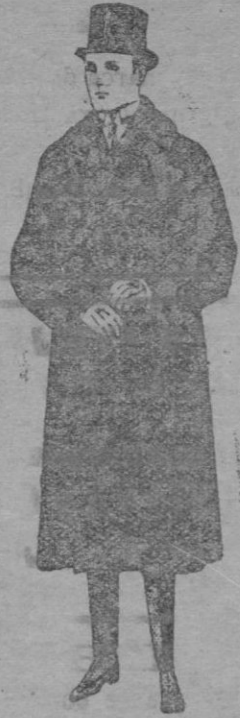
Gabanes de edredon negro, cuello y vistas piel. De ptas. 180 á 250 Con cuello de astrakán De ptas. 125 á 175