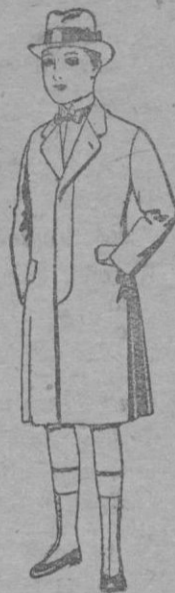
Gabanes de patén, para niños de 10 á 12 años. De ptas. 25 á 55