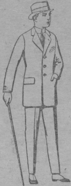
Trajes de patén, vicuña ó jerga, para niños de 10 á 12 años. De ptas. 27 á 73 Los mismos para jovencitos de 13 á 16 años. De ptas. 29 á 76