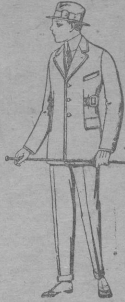
Trajes de patén, vicuña ó jerga, etc., forma Sport, para niños de 10 á 12 años. De ptas. 35 á 73 Los mismos para jovencitos de 13 á 16 años. De ptas. 38 á 76