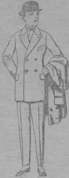
Trajes de patén, vicuña ó jerga, etc., para niños de 10 á 12 años. De ptas. 29 á 75 Los mismos para jovencitos de 13 á 16 años. De ptas. 31 á 78