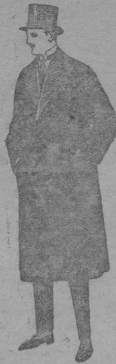
Gabanes de gamuza ó vigonia con vistas de seda. De ptas. 140 á 190