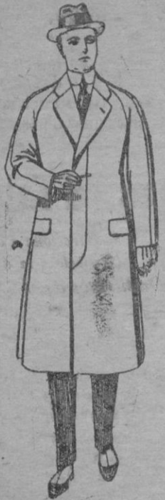
Gabanes de patén melton ó cheviot, con forro de seda, satén ó escocés. De ptas. 65 á 160 Los mismos á medida. De Ptas. 90 á 260