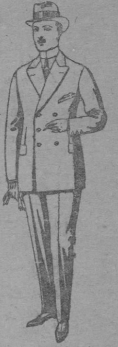
Trajes de cheviot, melton, vicuña ó jerga, etc. De ptas. 37 á 180 Los mismos á medida. De ptas. 85 á 250