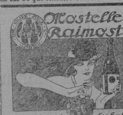
Jugo de uvas sin fermentar, esterilizado. Neurastenia, Estreñimiento, Dispepsia, Fiebras gástricas, Convalecencia. Ideal para los niños y parturientas. En Palma M. J. Coll, Plaza A. Maura, 14.

Oficial BARBERO se necesita. Barbería calle Marina, 48.