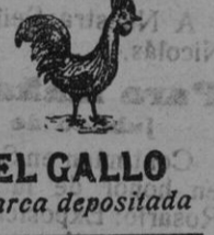
EL GALLO Marca depositada