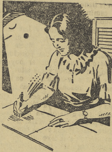
Hora tras hora

Por la tarde se celebró un banquete en varios hoteles de la capital, al que asistieron los profesores y alumnos de las academias militares y las autoridades, pronunciándose discursos y dándose vivas a España y al Caudillo.