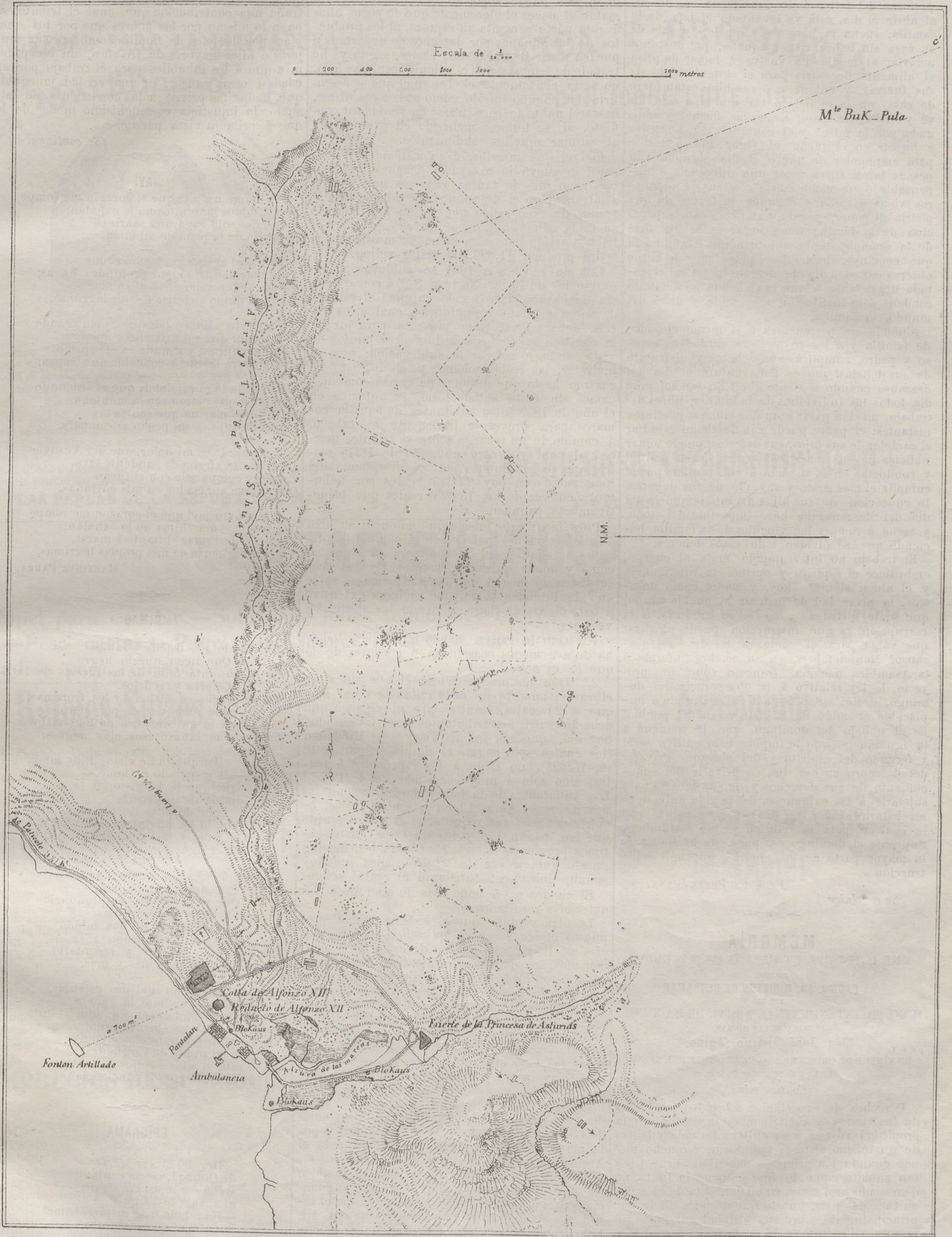
RECONOCIMIENTO DE EXPLORACION ARMADA DEL INTERIOR DE LA PLAZA DE JOLÓ.