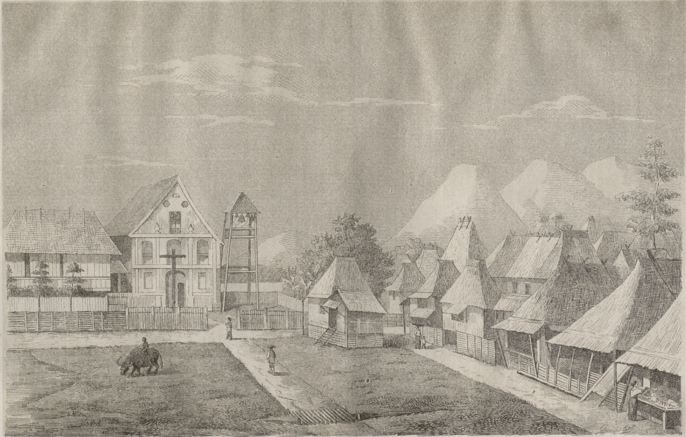
DINALUPIJAN. (Provincia de Bataan.)