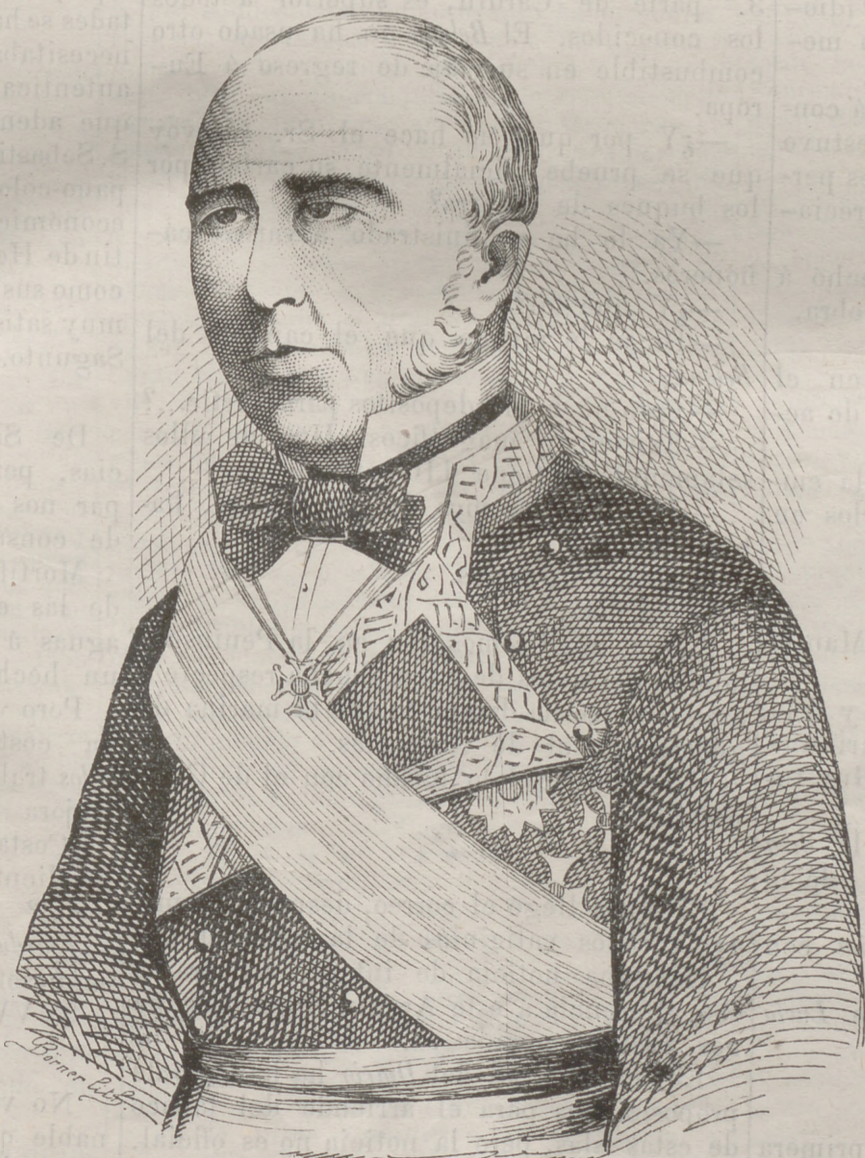
EXCMO. SR. VICE-ALMIRANTE DON FRANCISCO DE P. PAVIA, Ministro de Marina.

No son moco de pavo, los que nos esperan esta noche en Binondo.