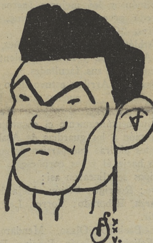
Paulino Uzcudun, que, según un comunicado oficial de la «I. B. U.», ha perdido su título de campeón de Europa en su match con Carnera

(Continúa en la sección de automovilismo)