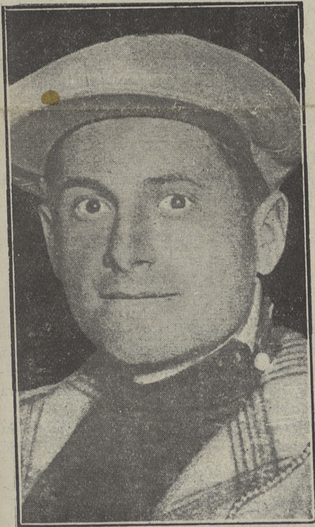
Alfredo Binda, el campeón del mundo que ha sido suspendido de licencia por la U. V. I.

si, por el no saber apreciar a cada enemigo en lo que vale, el Sevilla con el refuerzo que Deva, Silvosa, Fedé, le dan, unido a la clase de Ventolrá, Padrón, Campanal, etc., tiene que ser enemigo de peso fuera de su campo, y en él sobre todo. En cuanto al Athlétic, con desarrollo distinto, el caso es análogo; venció, pero con carácter de derrota, hay una notable diferencia de clase entre él y el Nacional, que debió reflejar el marcador, pero que no lo hizo por también un exceso de confianza en ningún caso disculpable, no es camino ese que lleve a colmar las aspiraciones; con cualquier contrario, se debe salir al terreno dispuesto al máximo desarrollo de energías y saber, único modo de no padecer sorpresas. Nos consuela la convención de que ambos sabrán enmendarse.