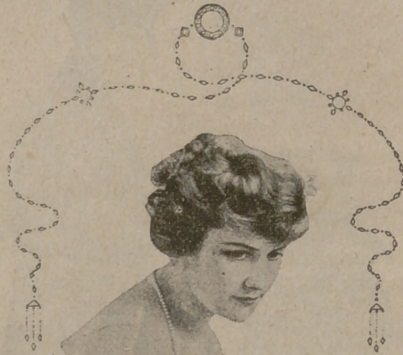
Número 2. — Ondulación al «negligé», con caídas de algunos bucles en la nuca, cubriéndose toda la frente muy al desdén.