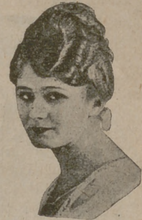
Número 3. — Peinado alto, exclusivamente para «suavé». La ondulación es casi imperceptible.