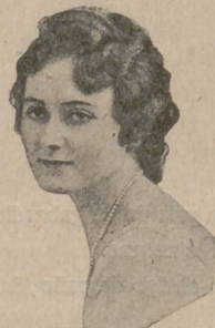
Número 10. — Las líneas clásicas rodean el rostro, sin cubrir demasiado la frente.