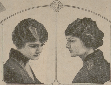
Número 5. — Moño bucleado en la nuca, a caer sobre el rostro de una manera naturalísima