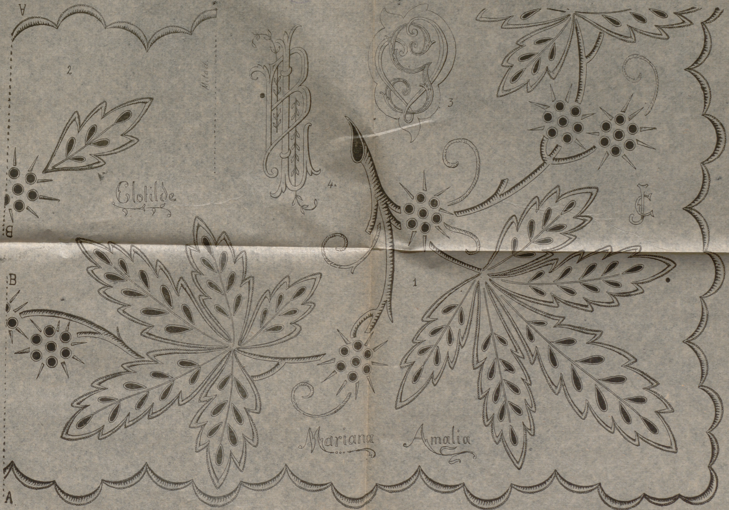
Número 1: Cenefa y ángulo, para bordar al realce y a la inglesa, para sábanas o manteles. — Número 2: Parte a añadir en el largo de la cenefa. — Número 3: Enlace GV, para bordar en manteles. — Número 4: Enlace LB, para bordar en toallas. Nombres y enlaces para ropa interior.