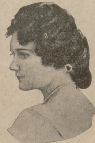
Núm. 11. — Las ondulaciones poco marcadas dan al rostro mucha dulzura. El moño, sumamente caído sobre el cuello, sujetándolo unas lindas horquillas novedad.