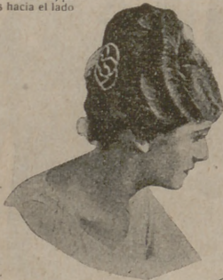
Número 4. — Casi el mismo peinado que los dos precedentes, adornándole de una peña incrustada en pedrería.