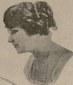
Número 7. — Los cabellos ondulados cubren enteramente las orejas, con el moño cerca del cuello.