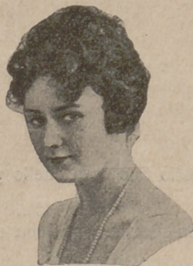
Número 9. — Las ondulaciones son irregulares, y el peinado es bastante alto.