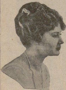
Número 8. — Cabellos ondulados, con apariencia natural, colocados bastante altos sobre la cima de la cabeza, adornándolos con preciosas horquillas fantasía