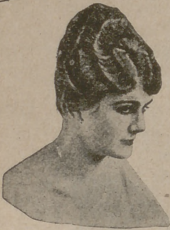
Número 1. — Peinado alto echado a la cara, pero escondido el moño. Los cabellos, partidos hacia el lado