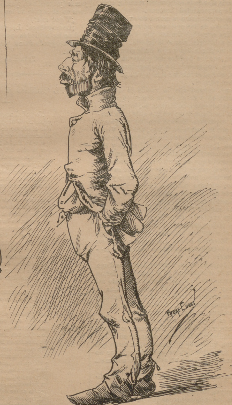
Y el país entre tanto mira embobado estos negocios como la cosa más corriente y natural.