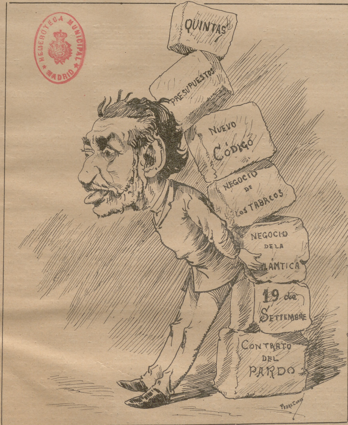
El edificio que has querido construir se derrumba. Huye pronto si no quieres morir aplastado por él.