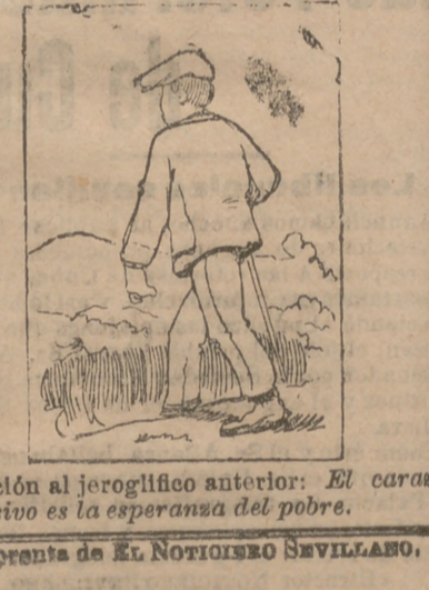
Solución al jeroglífico anterior: El caracol compasivo es la esperanza del pobre. Imprenta de EL NOTICIERO SEVILLANO.