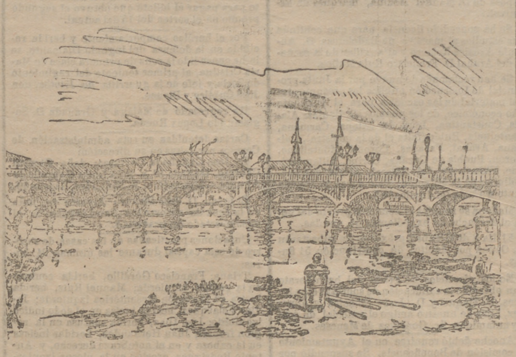
MANILA.—El puente de hierro llamado de España