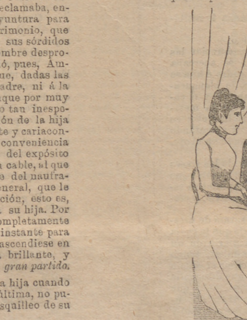
recibir por segunda vez el séptimo sacramento, por ver si de ese modo mataba la melancolía y

aburrido de vivir en completa soledad (pues mi único hijo estaba en el colegio militar de Toledo, y yo aislado muy lejos de mi país natal), que se apoderó de mí con tenacidad la idea de