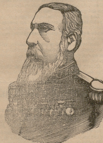
El rey de Bélgica

Es éste uno de los soberanos de Europa que más en paz y en gracia de Dios viven, al parecer. Y decimos al parecer, porque no es de los reyes cuyos nombres trae y lleva el telégrafo constantemente.