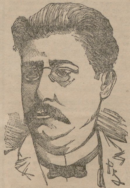
Alves da Veiga

No habrá en España uno que no haya oído este nombre, popular aquí, como populares son en Portugal nuestros repúblicos más eminentes.