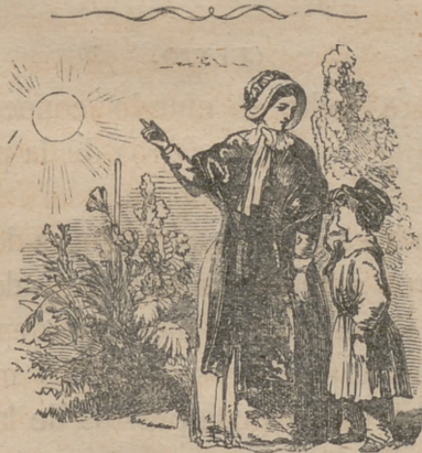
SALMO 19, 1-6.

L os cielos cuentan la gloria de Dios, y la espansion denuncia la obra de sus manos. Un dia emite palabra al otro dia, y una noche á la otra noche declara sabiduría. No hay dicho, ni palabras, ni es oida su voz. Por toda la tierra salió su hilo, y al cabo del mundo sus palabras. En ellos puso tabernáculo para el sol; y él como un novio que sale de su tálamo, alégrase cual gigante para correr el camino. De un cabo de los cielos es su salida, y su giro hasta la otra estremidad de ellos; y no hay quien se esconda de su calor.