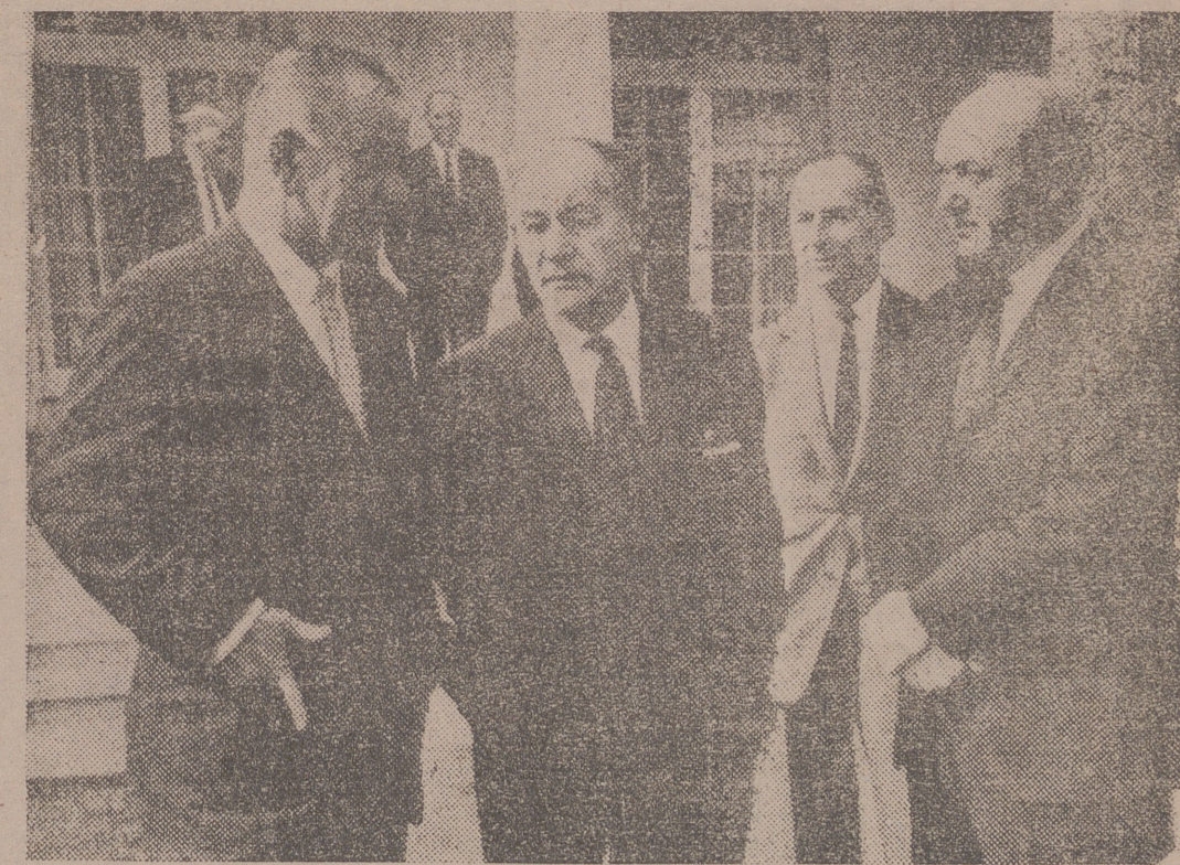
Gordon Walker, ministro británico de Asuntos Exteriores, ha visitado Washington para cambiar impresiones con el presidente Johnson y el secretario de Estado, Dean Rusk, entre los que le vemos en esta fotografía tomada ante la Casa Blanca.