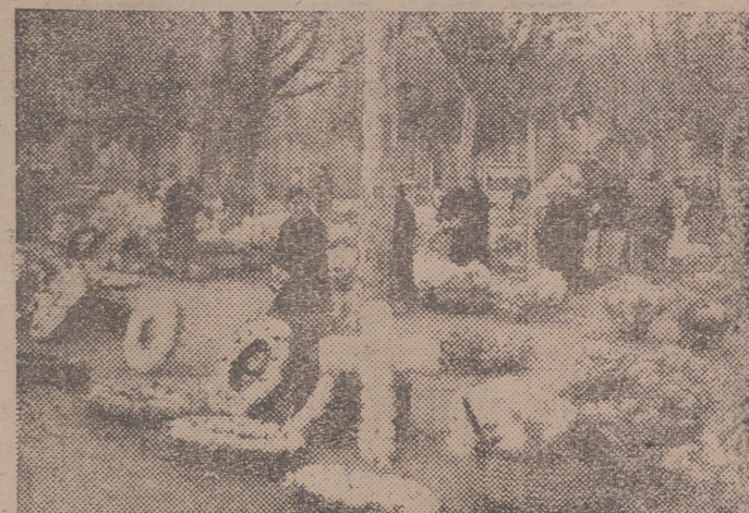
Un rincón animado del mercadillo de flores que, como todos los años, se instala en la Glorieta del Doctor Zubía la víspera de Todos los Santos.