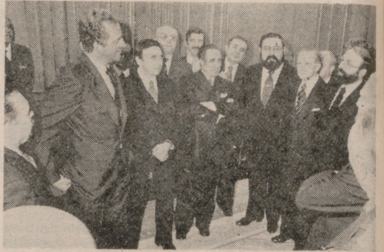
CON PERIODISTAS MADRID.—Como ya informamos, el Rey Don Juan Carlos ha recibido ayer en audiencia, en su residencia del Palacio de La Zarzuela, a los miembros de la Directiva de la Federación Nacional de Asociaciones de la Prensa de España. La representación de la Federación de Asociaciones de la Prensa ha estado presidida por su titular, Luis María Ansón.

La etapa legislativa que ahora comienza es de una importancia excepcional, en tanto en cuanto la nueva Legislatura deberá elaborar importantísimas leyes que desarrollan la Constitución. Esta circunstancia parece haber sido definitiva en la designación del señor Lavilla —jurista de reconocido prestigio— para la presidencia del Congreso, puesto para el que también fue candidato, según los mentideros políticos, el ex presidente del Senado, Antonio Fontán.