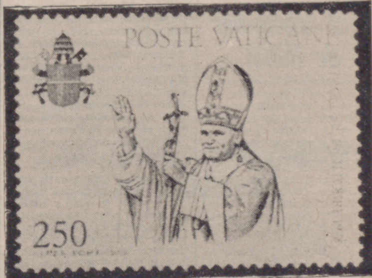
Una nueva serie de sellos ha sido emitida por el Vaticano con motivo del comienzo del pontificado del Papa Juan Pablo II. Los sellos, con un valor de 170, 250 y 400 liras, muestran el escudo de armas del Pontífice, el Papa impartiendo su bendición y Cristo entregando las llaves del Cielo a Pedro.