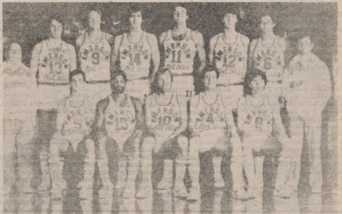
El Emerson de Varese, finalista por derecho propio.

(82-83) Prada desperdició la oportunidad de batir al Emerson