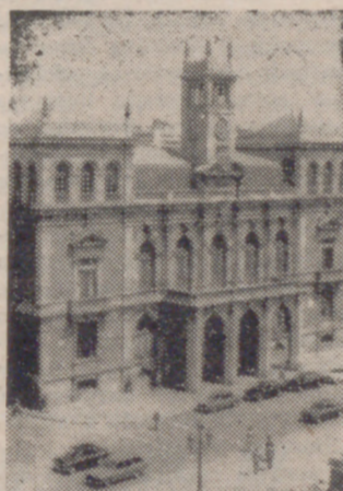
La dedicación al Ayuntamiento, ¿debe tener la adecuada compensación económica? Todos los partidos, salvo Coalición Democrática, que lo condiciona, opinan que sí.