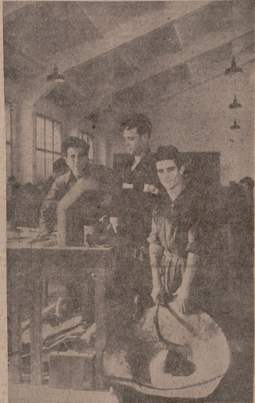
Organizado por la Jefatura Central de Trabajo del Frente de Juventudes, se ha celebrado en Zaragoza el XI Concurso Nacional de Formación Profesional Obrera, en el que han participado jóvenes trabajadores seleccionados en diversas provincias españolas.

EN SILENCIO. anónimo trabaja la caridad evangélica... Unete también a este quehacer extraordinariamente bello y reconfortante que es la CARIDAD en silencio.