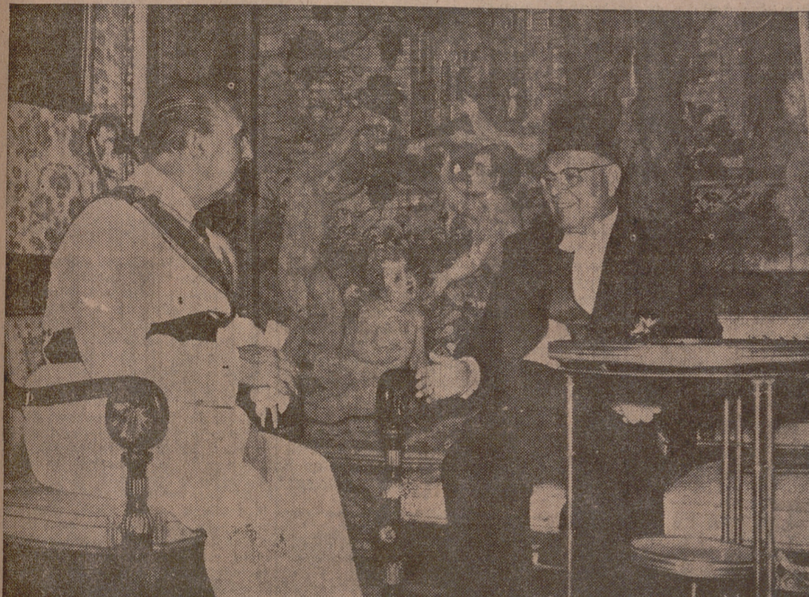
Madrid.—Su Excelencia el Jefe del Estado durante la ceremonia de la presentación de cartas credenciales del nuevo embajador de Libia en España, señor Taber-B. Oriente. Estuvo presente en la ceremonia el ministro de Asuntos Exteriores, señor Castiella.

El Vicesecretario de Ordenación Económica, acompañado de los gobernadores de Valladolid, León, Zamora y Palencia, da a conocer el alcance del Plan a los periodistas. En septiembre se reunirá el Consejo Ejecutivo para redactar el Plan definitivo.