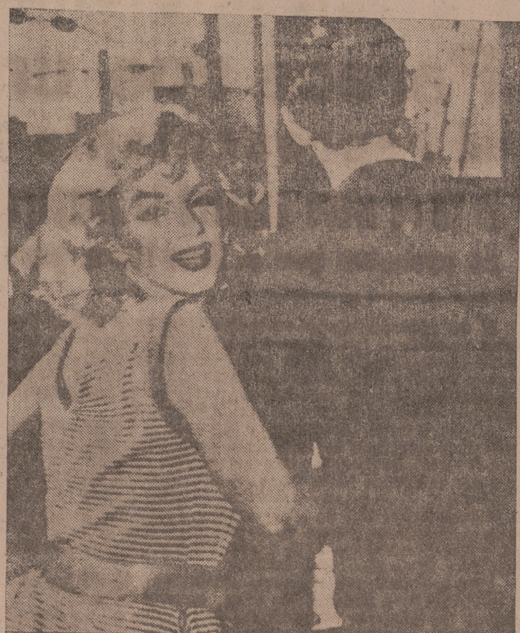
Arthur Miller con Inge Morath.

Después de su fracaso con Joe di Maggio, Marilyn comenzó a salir con bastante asiduidad