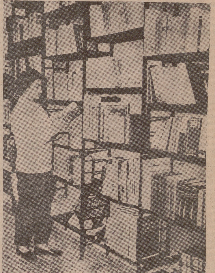
La mujer se ha lanzado a los trabajos intelectuales. Muchas horas de estudio que necesitan una justa compensación.

Esta exposición, que aparentemente nada tiene que ver con las mujeres, contiene, sin embargo, una gran enseñanza. La mujer es la reina del hogar y tiene en sus manos casi todo el tinglado de su formación. Por eso nos parece perfecto que en este II Congreso de la Familia Española se le haya tenido en cuenta, y tanto independientemente como formando parte de organismos e instituciones, se haya pedido su colaboración.