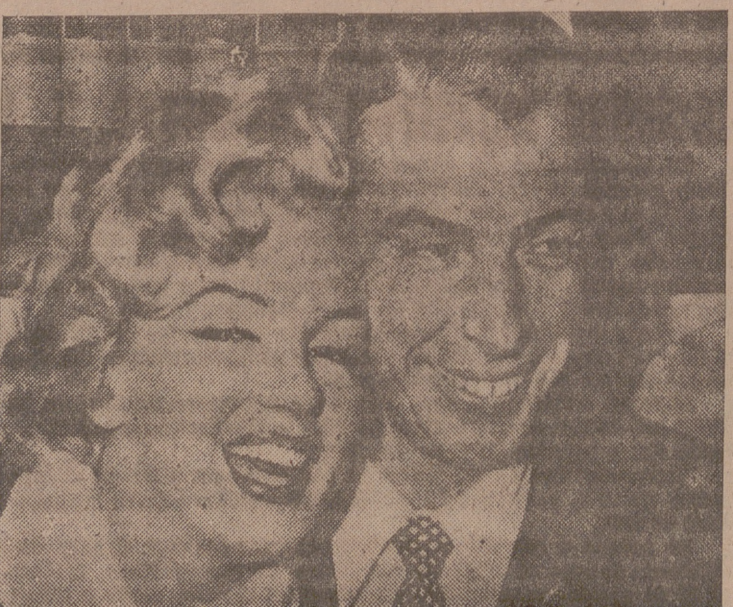
Marilyn Monroe y Joe di Maggio.