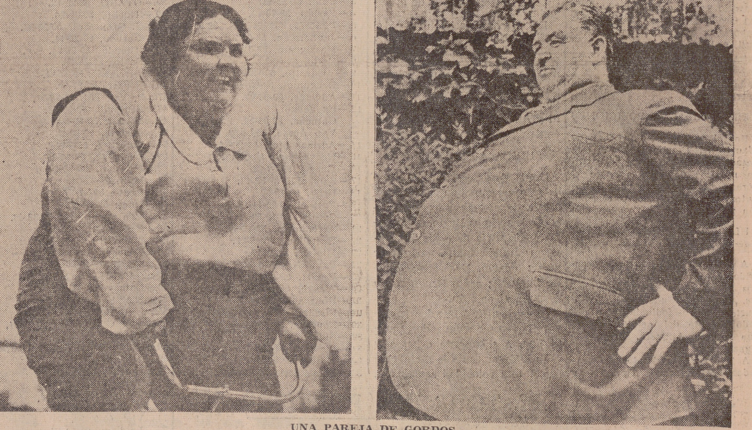
UNA PAREJA DE GORDOS

de lo biológico, es un signo negativo, tan negativo que las compañías de seguros de vida consideran un negocio ruinoso asegurar a un obeso, y para cubrirse previamente de todo riesgo, obligan a los gordos a pagar una demasia por exceso de