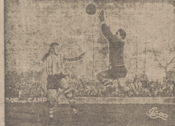
Aunque el meta avileño encajó seis goles, tuvo una actuación encomiable. En las fotos, dos de sus buenas intervenciones.