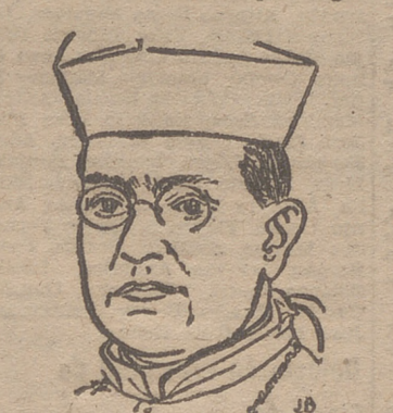
MONSEÑOR ARRIBA CASTRO