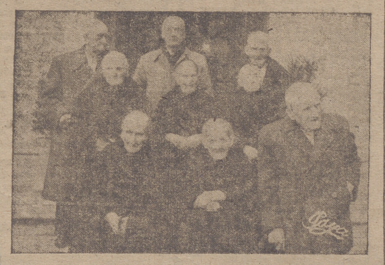
Los simpáticos y venerables ancianos, orgullo de la Rioja, entre los que se cuenta una vejecita con 100 años de edad, premiados por la Caja Provincial de Ahorros de Logroño en el Homenaje a la Vejez, tributado al conmemorar el Día Universal del Ahorro. (Información del acto, en 3.ª plana)