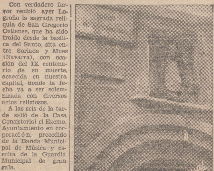
Un detalle de la fachada de la Ermita de San Gregorio Ostiense, en la calle Ruavieja, y en la que hoy se celebrará un piadoso acto.

Llegados a la Colegiata de Santa María de la Redonda. se organizó la comitiva que, por las calles de Mola y Sagasta, cruzó el Puente de Hierro, en cuyo final había de ser recibida la reliquia.