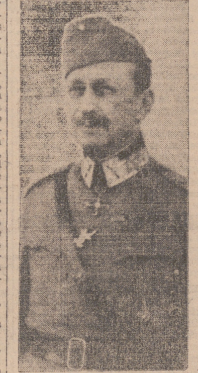
EL MARISCAL MANNERHEIM.

Abandonados a sus propias fuerzas por Gustavo IV, que rehusa enviar a Finlandia, invadida por el Zar, los 40.000 hombres de tropas regulares de que dispone, los finlandeses resisten heroicamente durante toda la campaña de 1808; pero en 1809 se ven forzados a capitular. Por esta vez, el espíritu heroico y noble de Finlandia encuentra en Alejandro I un adversario comprensivo y generoso. Se