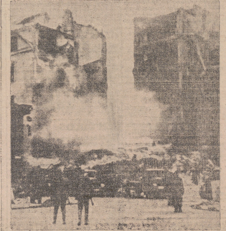
EFFECTOS DE UN BOMBARDEO SOVIETICO SOBRE HELSINKI.