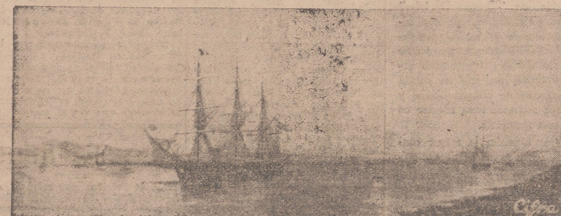
ESTE CUADRO QUE FIGURA EN EL MUSEO NAVAL, REPRODUCE LA FRAGATA «BERENGUELA», PRIMERA QUE CRUZÓ EL CANAL DE SUEZ.

A lo largo de su historia, el Museo se ha ido enriqueciendo, y hoy requiere ya edificio propio. Se ha acuñado una medalla conmemorativa