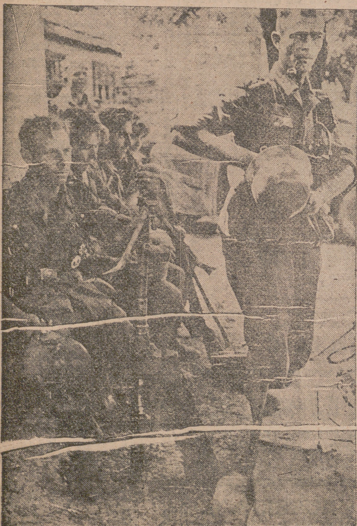
Después de varios días de enconado combate, en la gran batalla defensiva del Este, estos soldados alemanes entregan al placer del descanso.